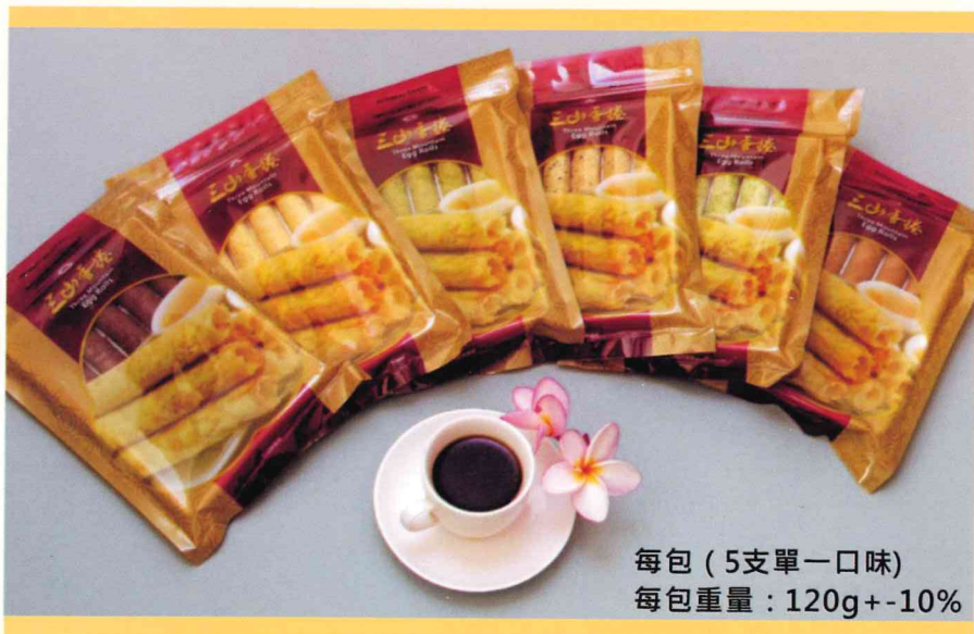
每包 (5支單一口味) 每包重量：120g+-10%