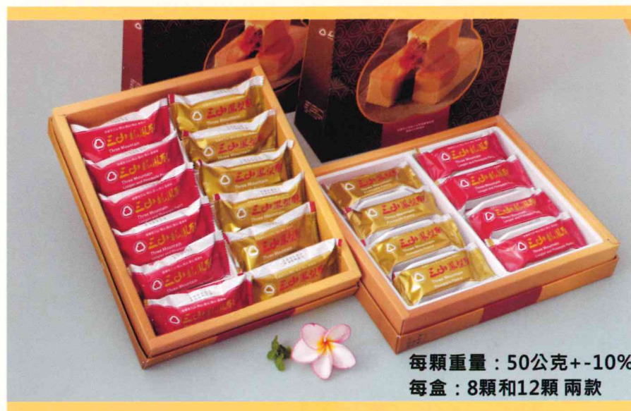
每顆重量：50公克+-10% 每盒：8顆和12顆兩款