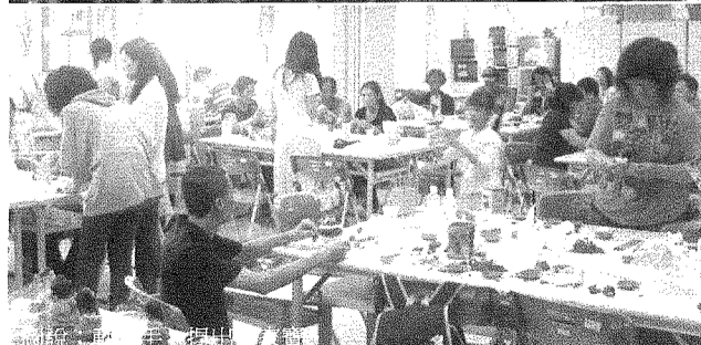
圖說：串起世代情~祖父母節。

多的時間從事蒐集、研讀資料，也有學生邀請身心障礙同學組隊參賽，計有十組學生報名。比賽結果由「動人心弦組」奪得第一名，該組針對心智障礙者規劃品質管理課程，從課程、實習、到就業的整套規劃，讓心智障礙者可以找到自己的工作能力；第二名「花組」則是以當紅的網路熱潮，協助身障者規劃網路行銷創業課程。