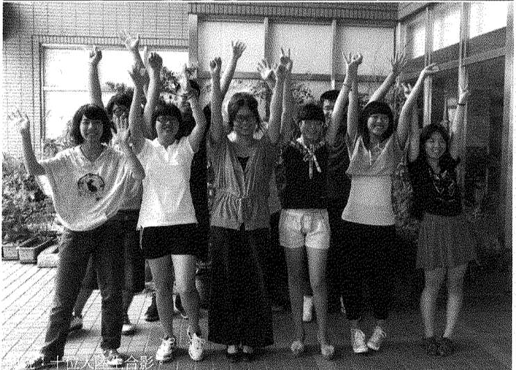
圖說：十位大陸生合影。