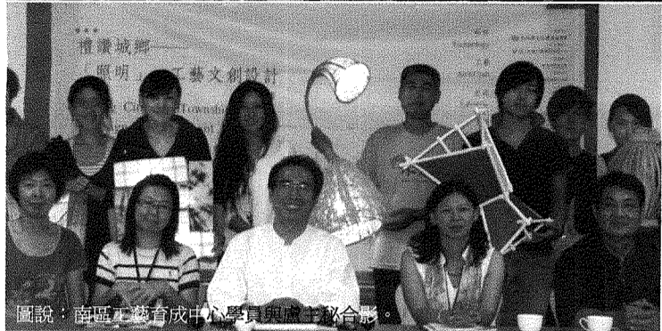
圖說：南區工藝育成中心學員與師長合影。