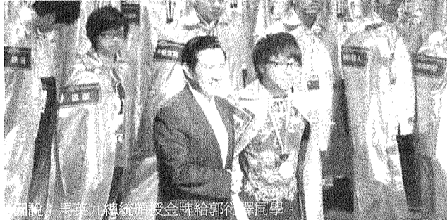
圖說：馬英九總統頒發金牌給郭衍驛同學。

未來將典藏於該學院，因此，龔蒂苑在畫作下方嵌入本校通識學院沿革，發揚學院精神；上方兩側以客家花布圖樣，凸顯客家文化在人文課程中欲表達的在地精神；而星空中阿姆斯特壯雄糾糾氣昂昂，改變人類歷史與科技創新的畫面，閃爍著夜光中浩瀚無際的宇宙；時鐘象徵著時代轉換，將古典與新知排列組合，以不同元素表達本學院課程的脈絡。