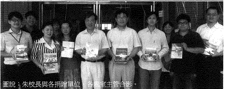
圖說：朱校長與各捐贈單位、各系室主管合影。