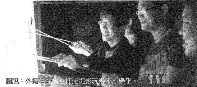
圖說：外籍生在舞台捕光捉影玩得不亦樂乎。

路行銷菁英」，目前已相繼投入職場從事網路行銷業務；為了讓教學的老師也能提升實務應用能力，資管系也指派五名教師在際標深耕研習，透過實際場域實地操作與研發，提升教師與產業結合的實務能力，並做為實務課程教材開發之參考；另一方面，藉由策略聯盟的交流，雙方共同探究解決技術研發困境，以及開創產學合作機會。