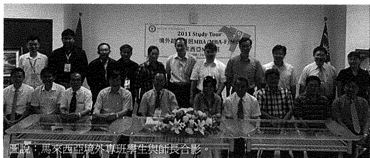
圖說：馬來西亞境外專班學生與師長合影。