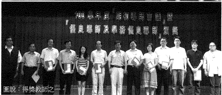
圖說：得獎教師之一。