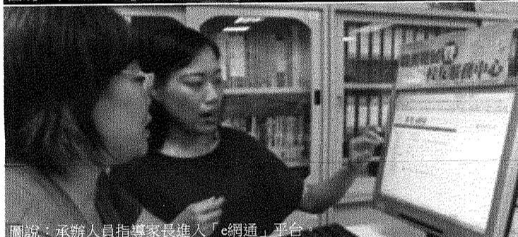
圖說：承辦人員指導家長進入「e網通」平台。

本校宿舍自創校起，以宿舍建置時間分別命名為第一、第二、第三及第四宿舍。四棟宿舍以數字開頭加深印象，第一男宿以氣宇軒昂、高視闊步的涵意取名「壹軒樓」；第二女宿以風姿綽約、姿容優美期待成為「貳姿樓」；第三宿位在湖邊，夕陽西沈、嵐翠鮮明，故取名「參嵐樓」；第四宿則期許樹德學子追求真、善、美、聖的好品格，故取名為「肆善樓」。讓宿舍命名與芭樂節結合，目的也是教育學生學習性別平等的互動，當天女宿雖是開放男士登門造訪，但也要取得當事人的應允與尊重隱私。