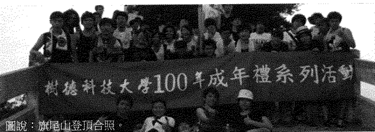
圖說：旗尾山登頂合照。