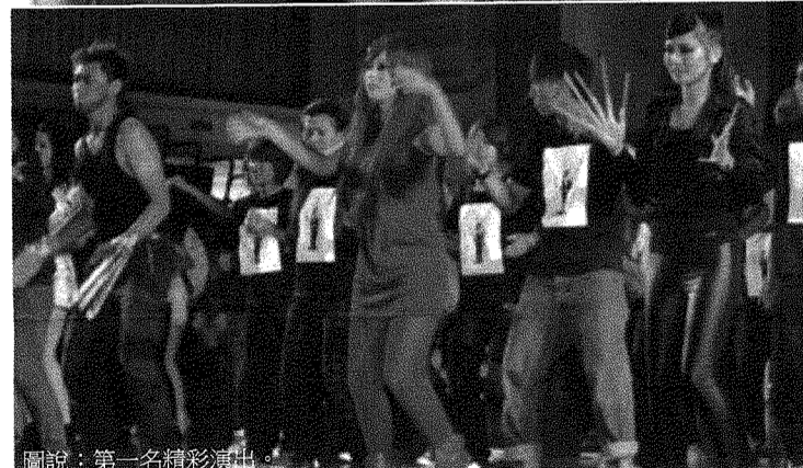
圖說：第一名精彩演出。