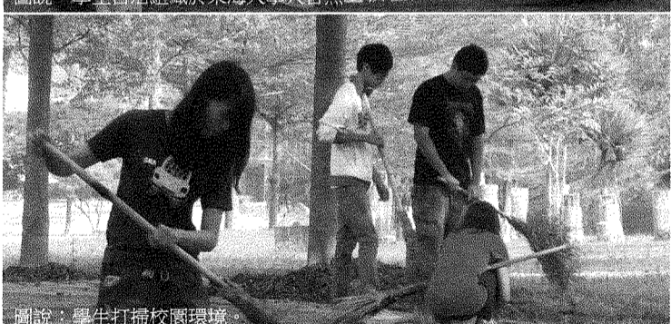
圖說：學生打掃校園環境。