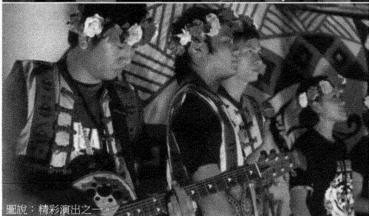
圖說：精彩演出之一。