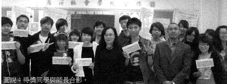
圖說：得獎同學與師長合影。