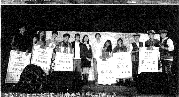
圖說：All in one母語歌唱比賽獲獎同學與評審合照。