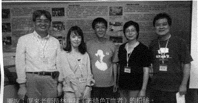
圖說：原來老師是林生祥(著綠色T恤者)的粉絲。

但是在「The Who's Tommy」音樂劇排演的過程，李凱文發現學生不熟悉1941至1965年的臺灣歷史，教科書也未特別詳載，走過那一個年代的人逐漸凋零。從太平洋戰爭的掀風波浪，日本殖民下的臺灣，臺籍兵、高砂義勇隊紛紛被征召，而擅長狩獵的原住民，在游擊隊中表現更是耀眼，無論最後的歷史評斷如何，原住民在臺灣的歷史中，都有其不可忽視的地位與重要性。