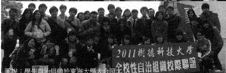
圖說：學生自治組織於東海大學大合照。