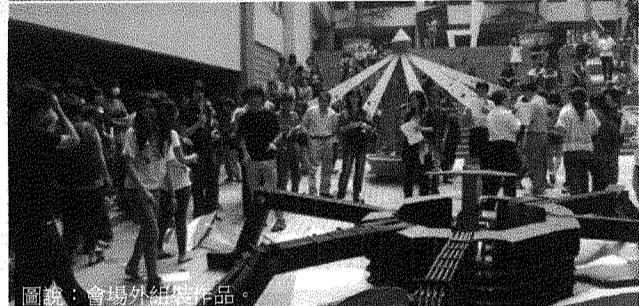
圖說：會場外組裝作品。

精彩的部份則是著名音樂創作家、金曲歌手林生祥也來到鍾理和紀念館。林生祥一邊講述客家鄉土風情、一邊吟唱融合鍾理和的「美濃山下」與「假婆」作品的曲目；林生祥並特別分享吉他音色如何升級、「月琴改造」的努力經驗，以及樂器質性與音色旋律間的幫襯關係，也傳達他對於美聲妙曲的執著與渴望；另外，師生一行也前往「美濃窯」，與藝術大師朱邦雄話陶壁、賞陶壁。