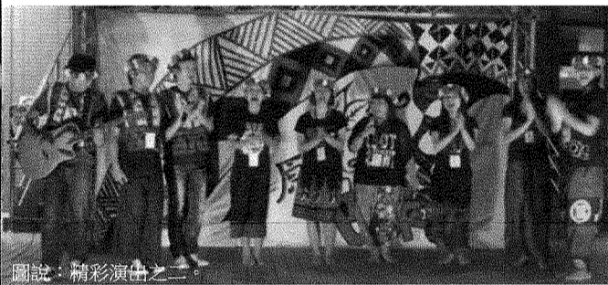
圖說：精彩演出之一。

【本校訊】學務處課外活動組與原勢力社以「原」勢力·巴萊」主題，召集原住民文化同好，載歌載舞、分享美食，並邀請到貓瓦東方舞社演出部落風肚皮舞，增添節目的豐富度；原住民節慶一定有的大會舞，也讓現場歡聲舞動，觀眾與演出人員手牽手、肩並肩，高唱族曲，大夥兒共享了愉悅、歡樂的熱情夜晚。