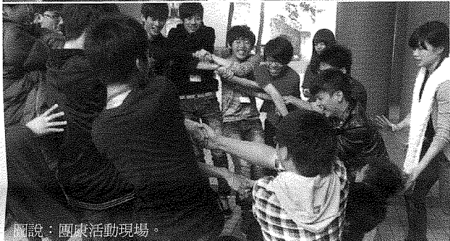
圖說：團康活動現場。