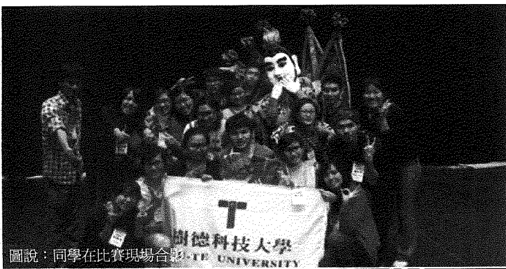
圖說：同學在比賽現場合影。