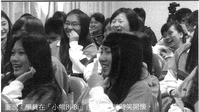
圖說：學員在「小熊Bibi」活動中時時笑開懷。