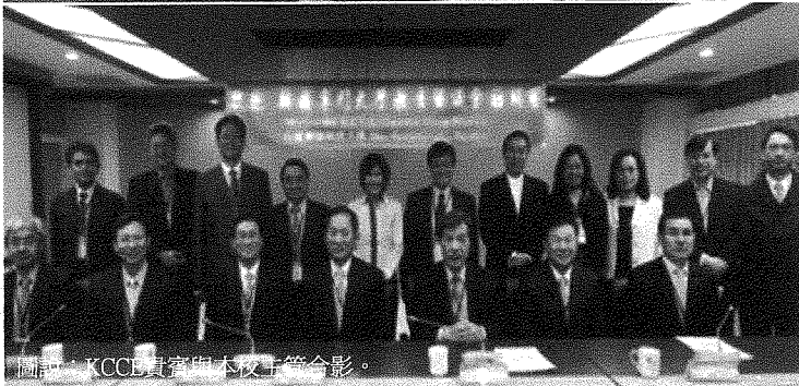
圖說：KCCE貴賓與本校正副校長合影。