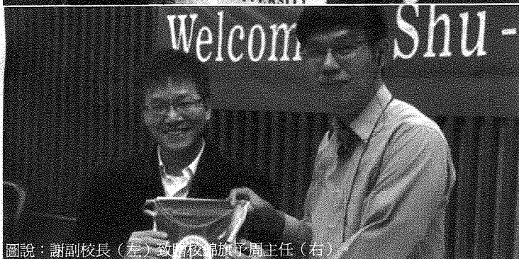
圖說：謝副校長（左）致贈校旗予周主任（右）。