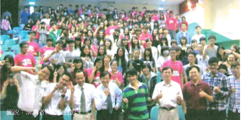
圖說：演講者與學生合影。