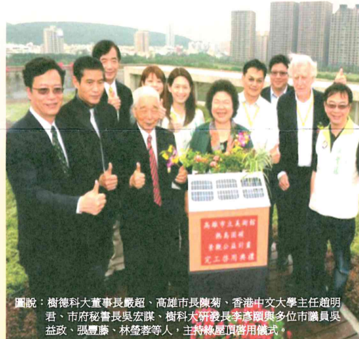
圖說：樹德科大董事長嚴超、高雄市長陳菊、香港中文大學主任趙明君、市府秘書長吳宏謀、樹科大研發長李彥頤與多位市議員吳益政、張豐藤、林瑩蓉等人，主持綠屋頂啟用儀式。

陳菊也表示：102年高雄市要舉辦亞太城市高峰論壇APCS，會議主題是「城市經濟新創能—城市挑戰，城市行動」，將與上百個國際城市交流多元前瞻的創新城市經營理