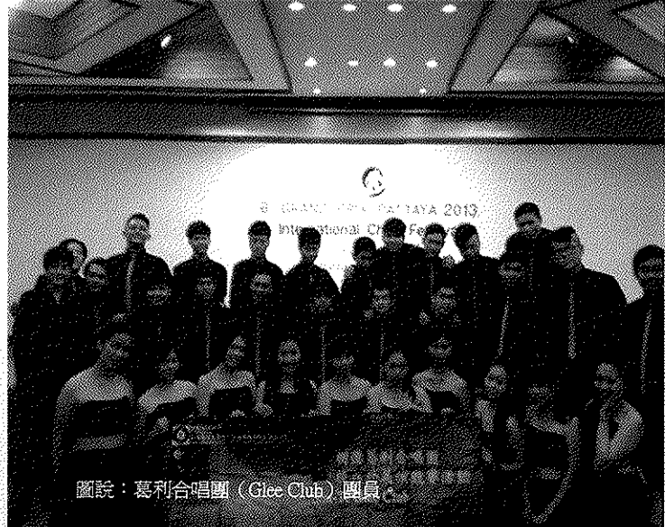
圖說：葛利合唱團 (Glee Club) 團員。