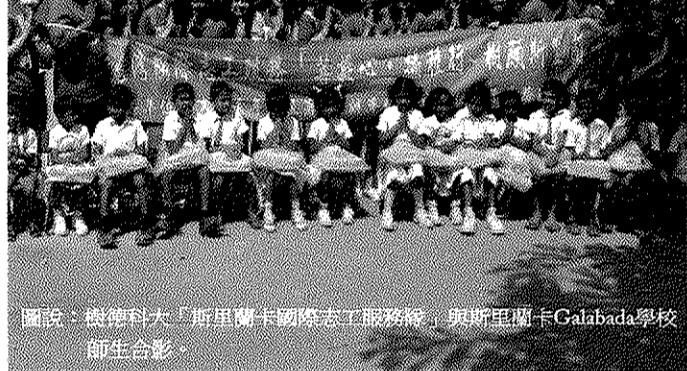
圖說：樹科大「斯里蘭卡國際志工服務隊」與斯里蘭卡Galabada學校師生合影