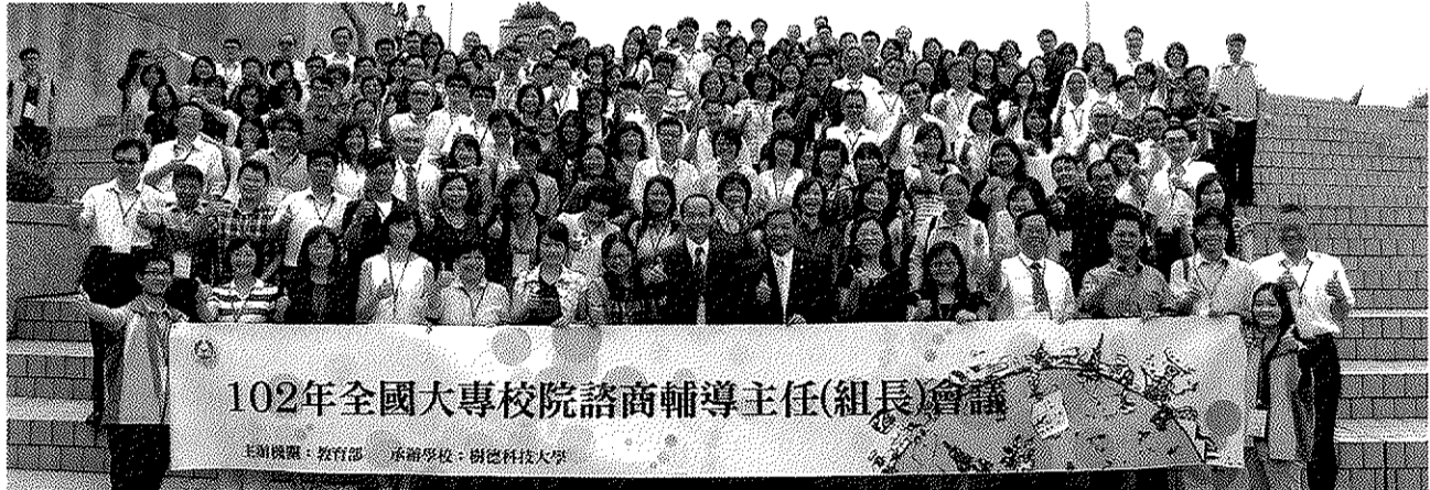
圖說：全國大專校院諮商輔導主任及組長與劉仲成司長與朱元祥校長等合影。

「輔導單位及人員角色定位」、政理技院吳怡堂主任分享「輔導單位現況之實施困境」、嶺東科大吳錦鳳主任談「輔導單位與校內資源之整合」等專題講座，劉仲成司長並主持綜合座談，聆聽輔導人員的建言及提問。