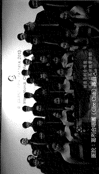
圖說：葛利合唱團 (Glee Club) 團員。