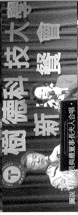
圖說：校長與副校長夫人合唱。