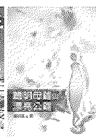
【聰明母雞 漂亮公雞】