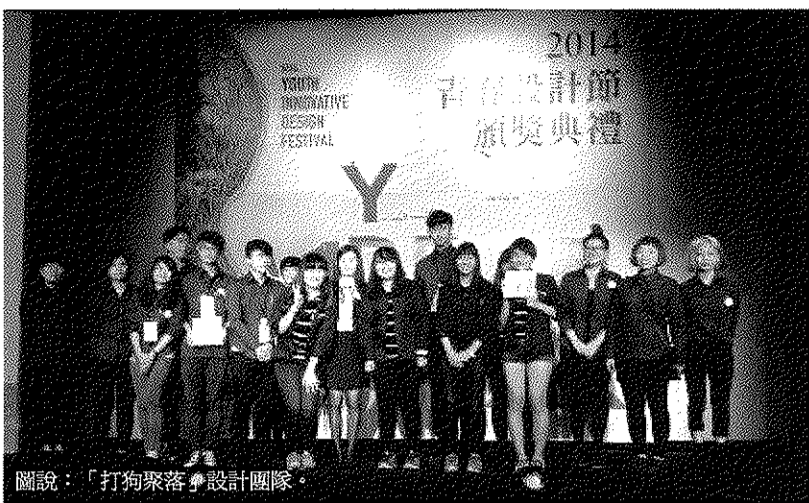
圖說：「打狗聚落」設計團隊。