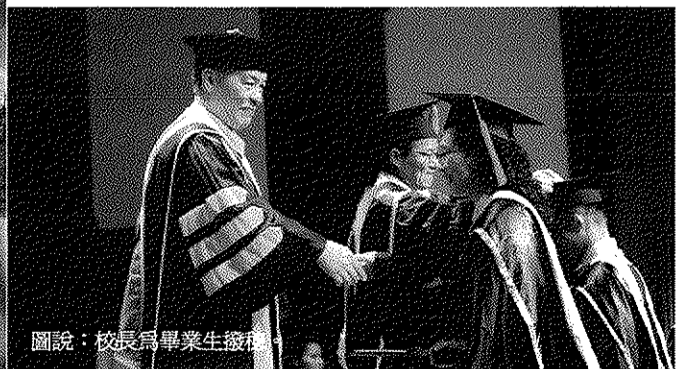
圖說：校長為畢業生授帽。