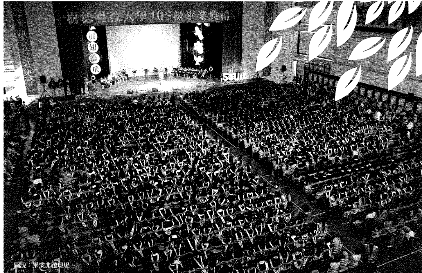
圖說：畢業典禮現場。

一年一度的暑假作業營又來了，炎炎夏日在這個暑假，別再讓你/妳家裡的弟弟妹妹開著，讓我們大手樹水城邀請陪您/您的孩子共同享受美好的暑假吧。本次所推出的活動，已開放報名(共有四梯次)： 1.擊岩(查詢活動地點請洽南區「漁樵」) 第一梯：7月17日~7月18日(四、五) 第二梯：7月19日~7月20日(六、日) 2.划帆(查詢活動地點請洽南區「漁樵」) 第一梯：7月24日~7月25日(四、五) 第二梯：7月26日~7月27日(六、日) 活動地點： 擊岩(本校上興擊岩場) 划帆第一天(大社游泳池)、第二天(蓮池港) 活動對象：南區國小、國中、高中