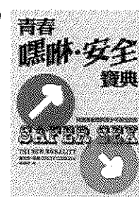
【青春嘿咻安全寶典】