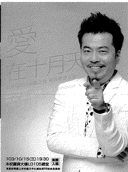
103/10/15(三)19:30 索票 本校圖書大樓L0105禮堂 入場 票價: 100元(含稅) 50元(含稅) 20元(含稅) 高雄市中區文化中心-至善廳