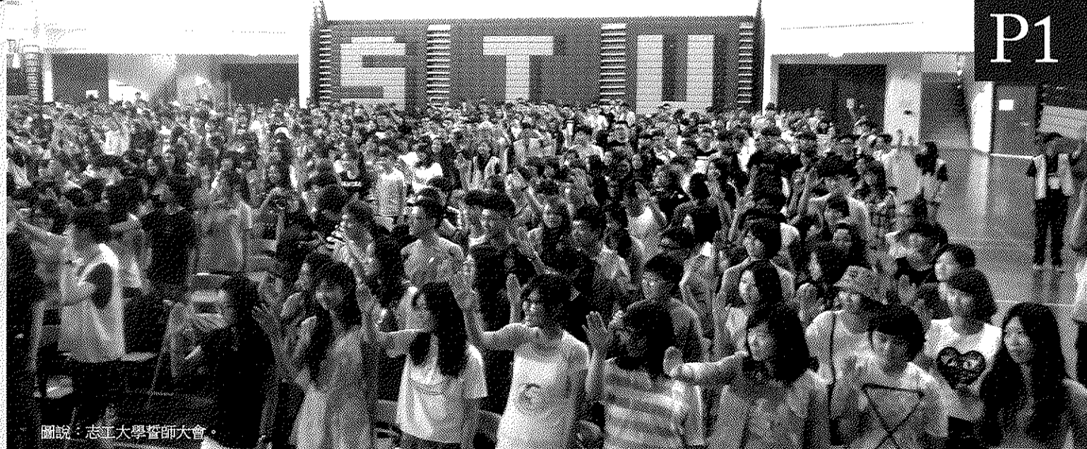
圖說：志工大學誓師大會。