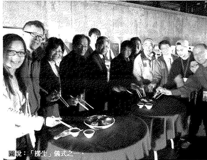
圖說：「撈生」橋式之一。

「愛老人、年菜愛團圓」公益短片，將由華山基金會擇期公開播映，請大家拭目以待並響應哦！