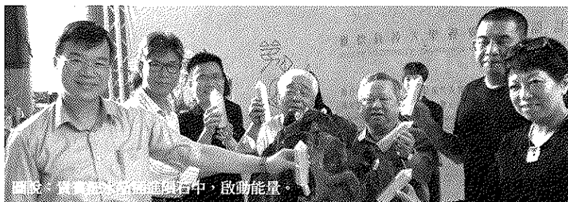
圖說：貴賓蒞臨在開幕典禮中，啟動能量。