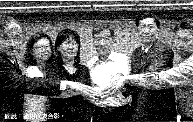
圖說：簽約代表合影。