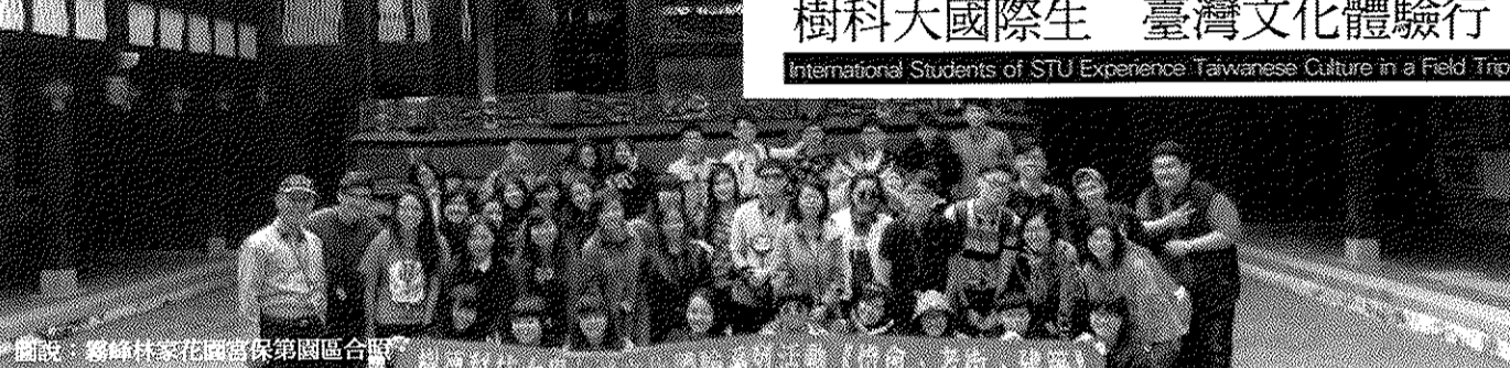
圖說：霧峰林家宮保第園區合照。