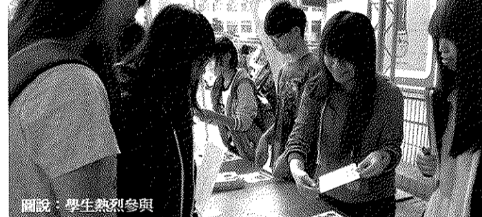
圖說：學生熱烈參與。

「權益月」系列活動都是與學生權益息息相關的議題，包括道南臨時停車場收費規劃、公車行駛校園現況、wifi連線使用狀況、行政服務、校內生活機能設施、社團活動等滿意度調查，以及利用闖關遊戲，讓同學更加瞭解申訴流程標準作業、權益問題小考試等，再再顯示民主社會在臺灣校園的開放作風。