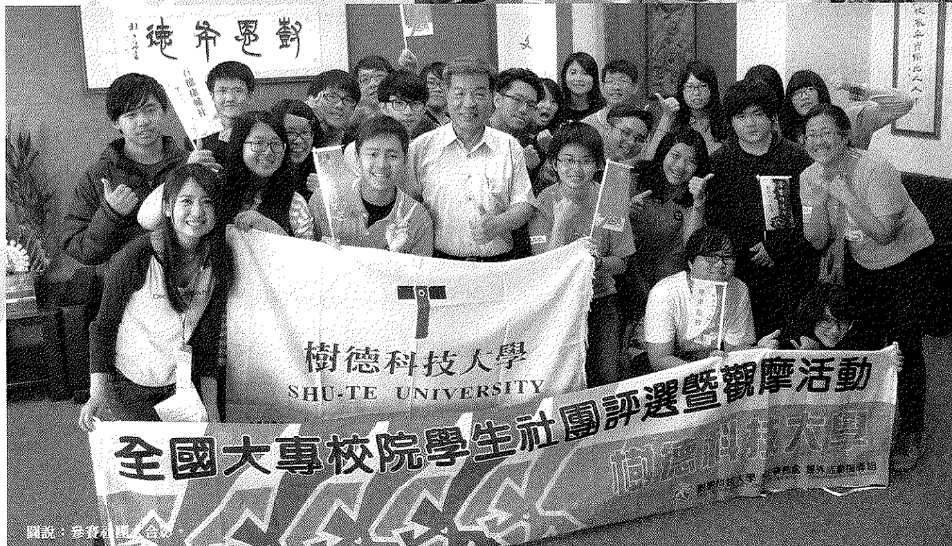
圖說：參加社團合照。