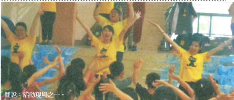
圖說：活動現場之一。

系主任邱鳳梓表示，流行設計系專業在於多樣性、多元化，從服裝、帽飾、織品到彩妝美髮都是展示重點，跨領域的學習也讓學生與職場銜接更快速。