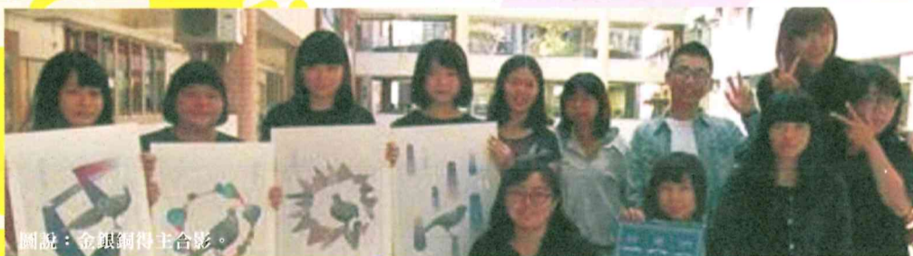
圖說：金銀銅得主合影。

【本校訊】視覺傳達系囊括由經濟部工業局高雄軟體策進會舉辦的「2015放視大賞」金銀銅等三大獎。本次放視大賞參賽者來自22所大學校院好手競技，競賽項目分為平面、動畫、遊戲（PC遊戲創作組、行動遊戲創作組）、跨領域、行動應用等類。視傳系獨占鰲頭，以「尋聲鳥」獲金獎、銀獎「尋鹿」、銅獎「走著橋」，在大學校院平面設計科系中，獨領風騷！