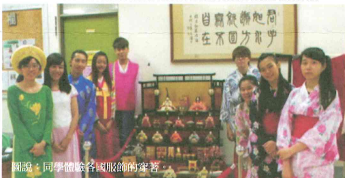
圖說：同學體驗各國服飾的穿著。