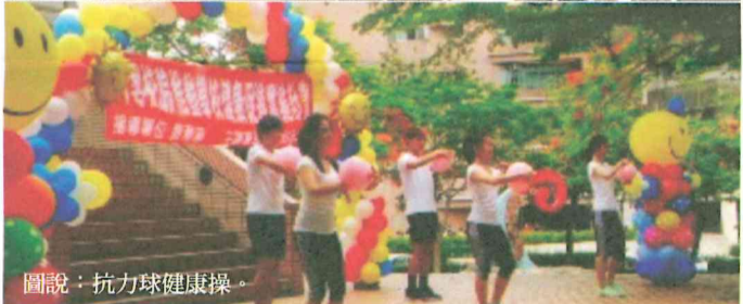
圖說：抗力球健康操。