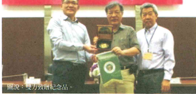
圖說：雙方致贈紀念品。