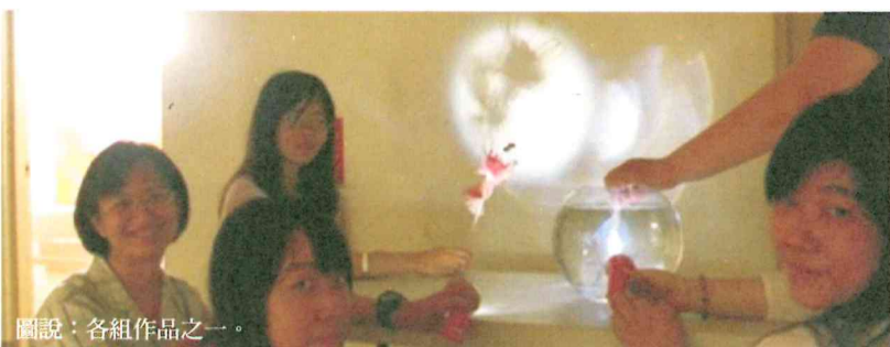
圖說：各組作品之一。