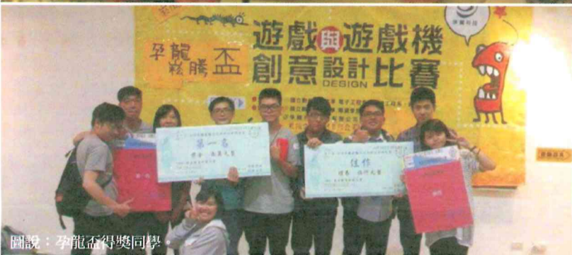
圖說：孕龍盃得獎同學。