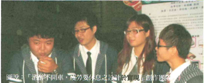
圖說：「酒醉不開車，疲勞要休息」之設計於實現」創作團隊。