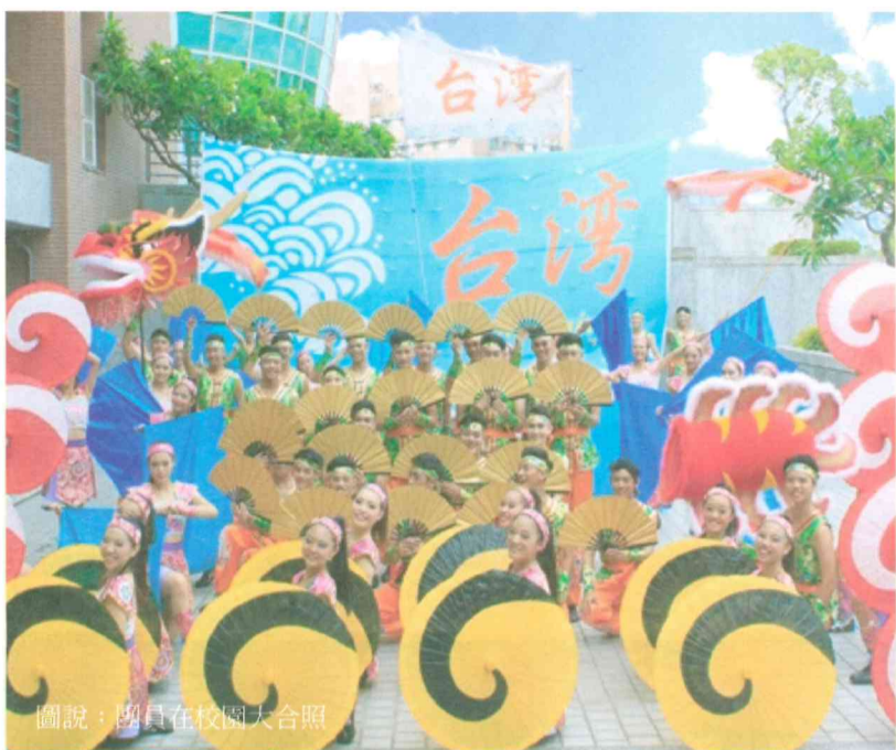
圖說：團員在校園大合照