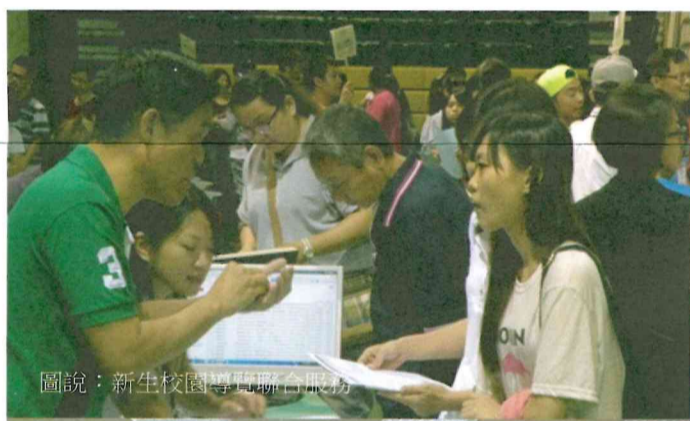
圖說：新生校園導覽聯合服務