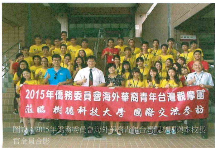
圖說：2015年僑務委員會海外華裔青年台灣觀摩團與本校長官全合影