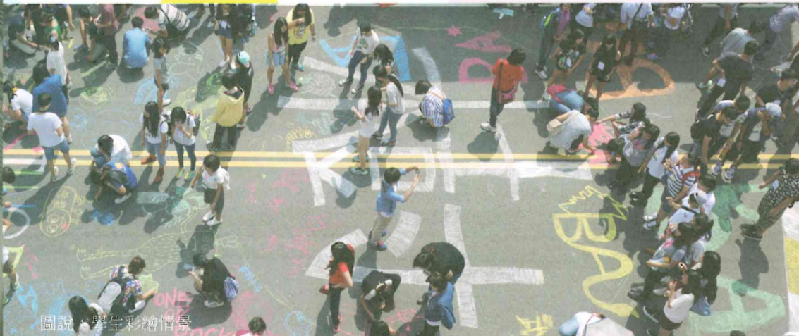
圖說：學生彩繪情景