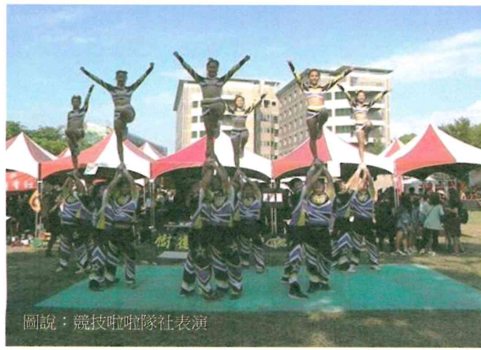
圖說：競技啦啦隊社表演