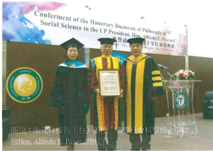
圖說：朱元祥校長（右）頒授「名譽社會科學博士學位」給Hon. Alfredo E. Pascual總校長