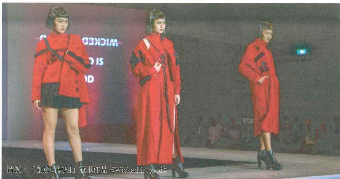
圖說：「創意時裝組」冠軍作品《Wicked is good》

評審委員都是活躍於業界的知名設計師，包括新銳設計 Austin.W 吳日云、沙布喇·安德烈、服裝設計徐秋宜、髮型設計李碩恩、彩妝造型曾小凡、整體造型吳思遠等各领域翹楚設計師，會場星光閃耀，同學雀躍不已。