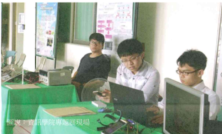
圖說：資訊學院專題展現場