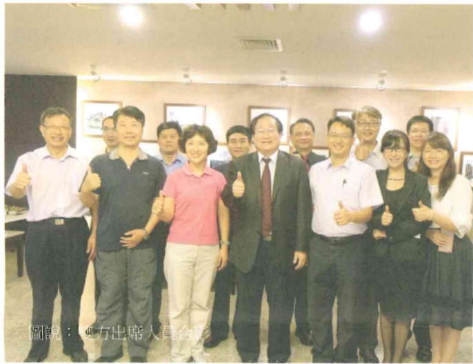
圖說：雙方出席人員合影