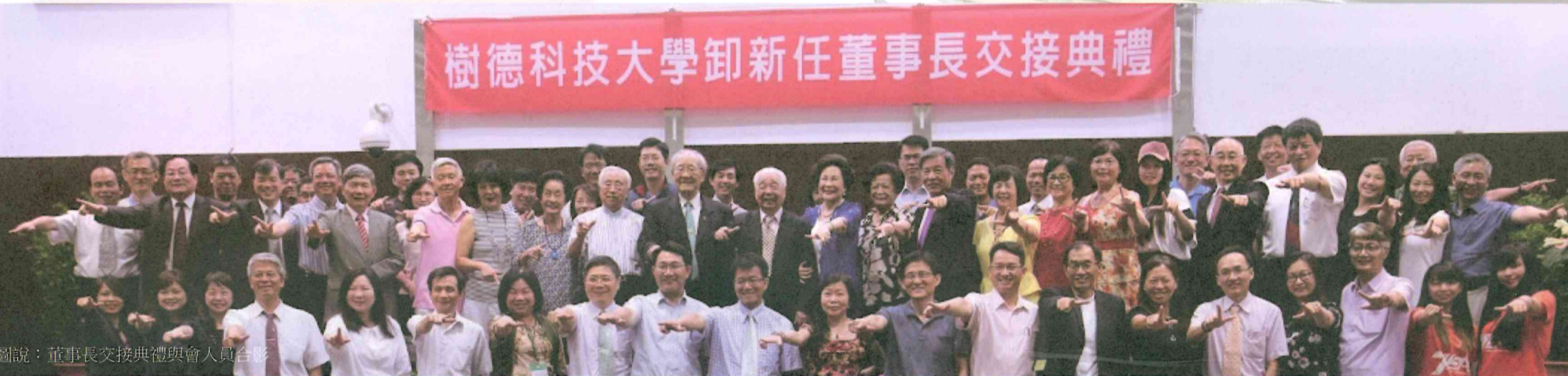
圖說：董事長交接典禮與會人員合影