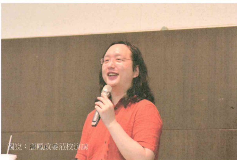
圖說：唐鳳政委蒞校演講