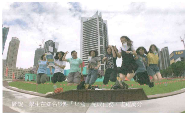
圖說：學生在知名景點「集盒」完成任務，雀躍萬分

參與學生表示，活動非常刺激有趣，不同以往的硬碰硬競賽方式，而是實際參與體驗，在競賽過程不僅學習到新的電商物流知識，在任務過程也享受了高雄在地美食，飽覽高雄美景。