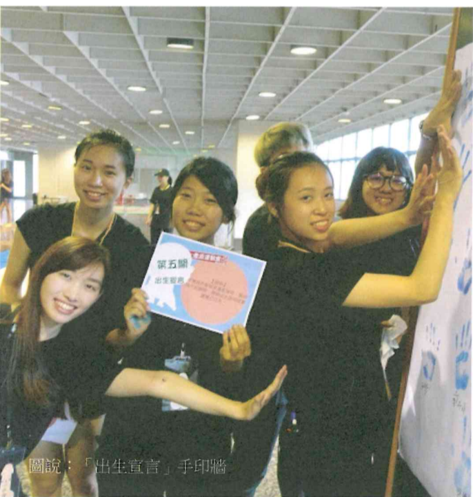
圖說：「出生宣言」手印牆