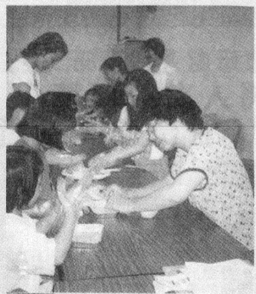
圖：幼保系於兒童中心舉辦「溫馨親子情」系列活動，廣獲好評。