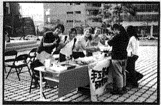
圖一、手語社同學現場製作東凍蠟燭。

康輔社則是充滿活力與歡笑的帶動唱，將現場氣氛炒得更High；而靜態的社團如咖啡社與手工藝品社則展現社員們的巧手，香醇的咖啡與DIY的手工藝品就是出自他們的手。 本活動歡迎全校教職員生共同來參加，讓我們一起為表演的社團加油打氣！本活動還有4次的表演時間：11/27、12/11（校慶擴大舉辦）、12/15（校慶聯合表演）、12/25（聖誕節慶祝表演），下午15:30~18:00，在寄情湖上方扇形廣場，記得各社團都熱情的等您來參與喔！