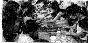
上圖、本校啦啦隊對精采演出。下圖、手工藝品社同學教小朋友製作小飾品。