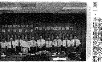
圖二、本校與全家便利商店股份有限公司簽訂策略聯盟合約。