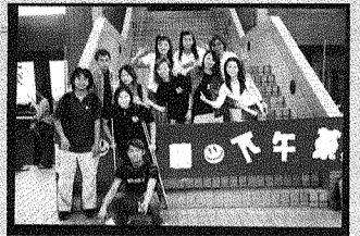
圖二、手語社同學表演。