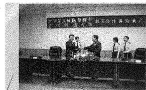
圖：指揮官謝少將與本校空軍三指部副指揮官。

式由朱副校長與空軍三指部指揮官謝少將共同主持，在簡單隆重的簽約儀式後，並舉行了簽約茶會，共同舉杯慶祝此次合作成功，更希望未來合作順利愉快。(戴淑芬撰稿)