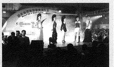
圖為本校流設系學生擔綱演出的開幕造型走秀。

本校校長朱元祥出席了開幕剪採儀式，隨後陪同陳水扁總統欣賞本校擔綱演出的整體造型動態秀，並參觀本校籌劃的主題館與未來館。朱校長表示，本校擁有全國唯一整合髮型、化妝、織品、服裝四項專業的整體造型設計科系與研究所，培養學生成為國際造型設計專業人才，具有深厚的人文素養與專業的技術能力，經常獲邀在國際重要慶典活動擔任造型秀貴賓，在紡拓會、毛衣工會等單位舉辦的多次國際設計競賽中屢獲佳績，深受好評。