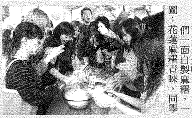
圖: 們面享受美味。花蓮麻糬青睞, 同學們面享受美味。

活動展出項目包括: 台北阿給比賽、竹槍自製; 新竹地區放風箏、踩高蹺活動; 彰化肉圓; 台南地區撈魚、打彈珠及煮礮糖; 宜蘭天燈自製及洩瀾采風; 花蓮地區自製麻糬等項目。