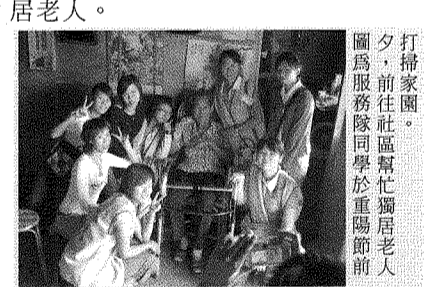
夕，掃榻而歸。圖為服務隊同學於重陽節前前往橫山村協助獨居老人。