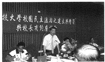
圖為校長朱元祥於「與校長有約座談會」中接受學生代表諮詢。

學生的提問無奇不有，舉凡校園教學、行政、各項服務，以及生活管理等等，校長也都鉅細靡遺地一一說明。對於現行制度規章無法立即修正的，也允諾尋求解決方法。