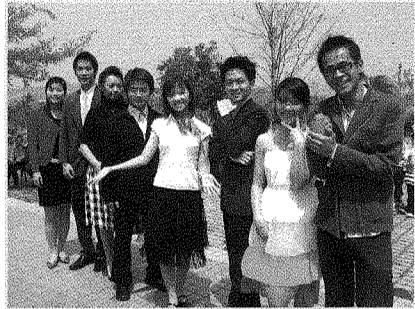
圖為第六屆樹德先生小姐選拔初賽，8位入圍者亮相角逐最佳人氣獎。

決賽預計於5月17日登場，主辦單位將邀請專業師資，教授同學有關美容美儀、台風、口才、膽量等訓練課程。隨後並安排一系列宣傳造勢活動及人氣投票選拔，支持者可於圖資大樓投下心中所支持候選人人氣選票。