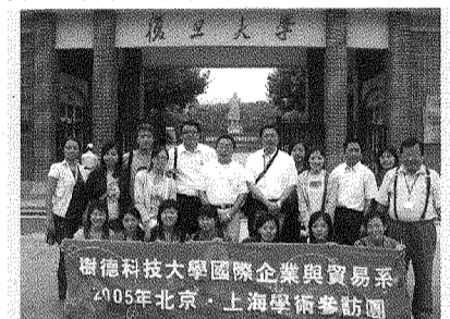
圖為國企系師生參訪上海復旦大學。

由於中國大陸近13億人口的龐大消費力，吸引全球知名企業前往投資，加上兩岸經貿關係日趨頻繁，對中國大陸經濟的瞭解已是當前國際化人才必備的知識，因此標榜「樹德育菁英、國際展宏觀、企業經八方、貿易達四海」的國企系，選在暑假前往中國大陸參訪，不僅提升學生國際化視野，也提早讓學生感受兩岸人才的優劣勢，為自己未來的生涯做好定位。