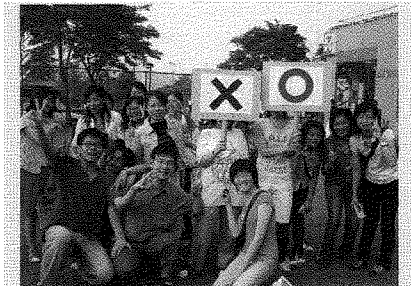
圖為同學參與「大風吹」活動。

貼心的主辦單位在寄情湖畔規劃了一條透過圖像、聲音、影片、走動方式呈現的「心光大道」，讓全校師生可以在大道上的每個情境站，藉由「生命圖像」、「音樂SPA」、「故事精靈」、「勇敢氣出來」、「憂鬱指數自我檢測」等，學習自我照顧、自我疼惜，讓走在心光大道上的自己越走越心越光明、越有能量。