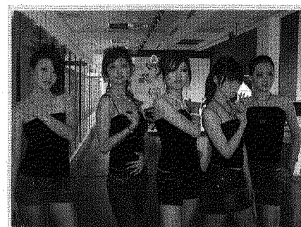
圖為時尚表演社同學佩帶作品走秀，展現金工之美。

楊彩玲老師表示，希望藉由展出提供金工藝術家創作及展現空間，可將金屬工藝普及為可消費的商品，達到文化創意產業推廣的目的。