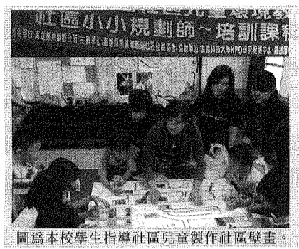
圖為本校學生指導社區兒童製作社區壁畫。

第二梯次進入實作課程，小朋友將記錄的寶貴經驗，以照片和壁畫製作的方式，呈現社區的「真實風貌」，確實了解社區環境的優點與缺點，進而對社區產生關懷和興趣。最後，社區小小規劃師則將規劃好的理想社區製造成實體模型。