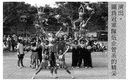
圖為冠軍隊伍企管系的精采演出。

【本刊訊】為慶祝本校八週年校慶，學務處於94年11月23日舉行的「啦啦隊」競技比賽，精采的比賽最後由企管系獲得第一名，休管系及流設系分獲第二、三名，最佳創意獎為金保系、最佳精神獎為視傳系。