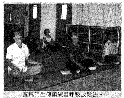
圖為師生仰頭練習呼吸放鬆法。

【本刊訊】本校諮商與生涯發展中心為了抒解師生壓力，訓練自我解壓的技巧，於94年11月1日至11月4日舉辦「跟壓力說bye bye—情緒管理與壓力抒解營」系列活動，讓師生學習自我放鬆方式。