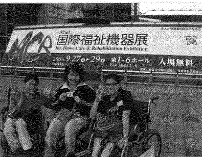
圖為前往日本國會的百萬築夢計畫選手。

在跑道上加裝軌道拉桿及聲音辨識，提供視障者也能享受跑步的樂趣；而桌球運動則由凌空改為桌面推打，球體並加上聲音的設計，讓視障者也有機會體驗桌球運動，各個空間的隔音設備更是完善，視障者完全不會受到聲音的干擾。