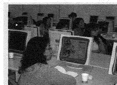
圖為本校電算中心與高雄醫學大學人員分享校務資訊系統的開發經驗。

程主任表示，今後，除了持續提昇優質網路服務外，將繼續增設校務資訊系統的負載平衡技術、以及SSL VPN連線服務，更將提供完整的個人化入口網路服務。而對外網路除了原有的TANet之外，將持續與TWAREN高品質研究網路結合，提供IPv6、MPLS、VoIP及多點視訊傳輸等服務。