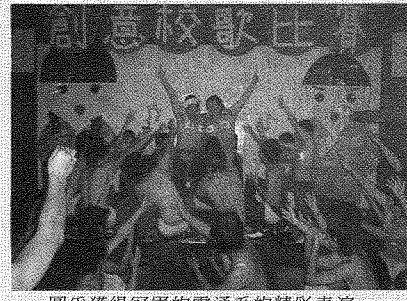
圖為獲得冠軍的電通系的精彩表演。