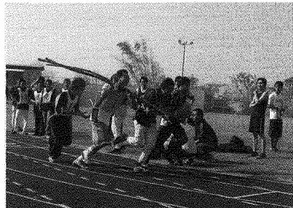
圖為參賽同學扛著甘蔗奔跑的蔬果接力賽。

建古系的師生表示，為了辦好這次盛會，自去年8月即廣發英雄帖、籌劃募款事宜。除獲得社區內可口可樂企業贊助之外，高雄市神采飛揚KTV也提供礦泉水；其他如學生經常前往維修的機車行老闆、校內咖啡餐飲店、設計學院院長、系主任，以及系上老師也都慷慨解囊給予實質的協助。