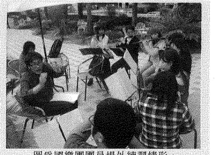
圖為國樂團團員場外練習情形。

【本刊訊】本校國樂團表現不凡，今年在全國學生音樂比賽中再創佳績，分別榮獲大專團體組國樂合奏優等及絲竹室內樂合奏優等，成績耀耀。該支生力軍由校內喜好國樂的58位同學組成，並從中選出15位擅絲竹樂的同學參與絲竹室內樂賽。該團成立的目的是希望透過樂團的訓練，讓學生有實際參與演出的機會，同時也因每年辦理場地的不同，學生也可從中