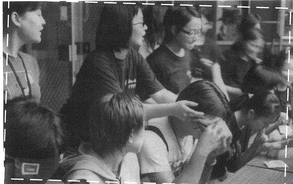
↑ 新生迎新會各種的花絮

可能是因為要相認的關係吧，那天我和大家的心情都一樣.. 特別興奮，聽說這屆學弟妹們各個可都是俊男美女呦~~~。不料系學會竟然