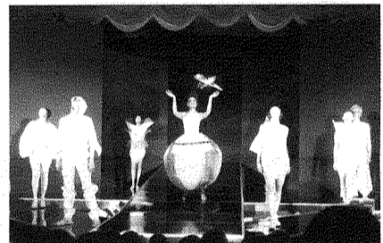
圖為「魅·衍」作品，學生舞台架式不輸專業模特兒。

這場時尚走秀由該系第六屆113位應屆畢業生，藉由15組造型秀作品呈現四年來所學的織品、服裝、造型等與藝術、科技、人文結合的創意發想。