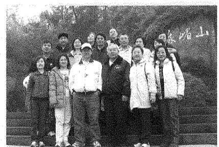
本校16位團員在峨嵋山登山口留影。

回到成都，幾次穿梭期間，終能一親芳澤，它超乎我想像的繁華，有些團員已是第二次造訪九寨溝，比較第一次的情景，有感大陸的進步，真值得台灣的警惕。