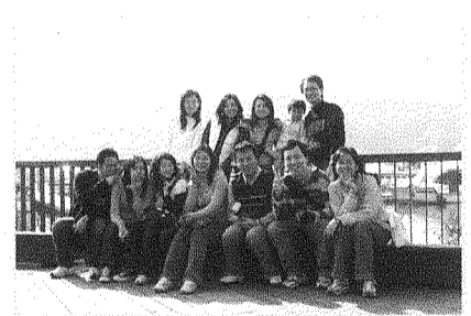
圖為一行人於日月潭德化潭碼頭歡樂合影。

但是...我可是已經開始期待下一次的員工旅遊了呢！每當別人羨慕我能免費享受涵碧樓時，我也會告訴他，樹德科大的好其實不止這一個，而且，此時在我心裡就會有個聲音堅定地說著：「當樹德人，真好！」