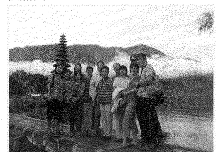
本校12位團員在山中湖的合照。

此次最大收穫是體驗到一大群認識的人一起出國旅遊，那種歡樂開懷與凝聚力，實無法用言語形容。團員約定明年再次同遊，更歡迎全校教職同仁加入。