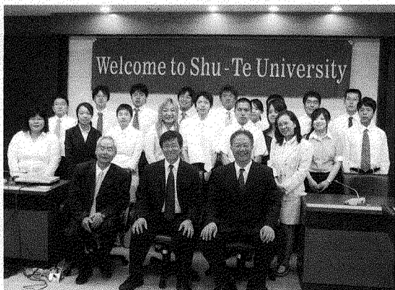
▲ 帝京大學師生與本校教師合影

本次參訪成員多為帝京大學四年級學生，由於成員皆是在日本研究東洋史的學生，故其對台灣的未來或過去都具有極高度的興趣，也因此出發之初，同學們即積極規劃行程與搜集資料，希望讀萬卷書、行萬里路的驗證，能讓成員更加了解台灣與日本的緊密關係。