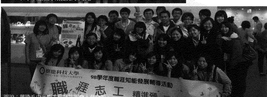
圖說：興隆毛巾工廠參訪與會人員合影。