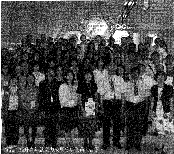
圖說：提升青年就業力成果分享全員大合照。