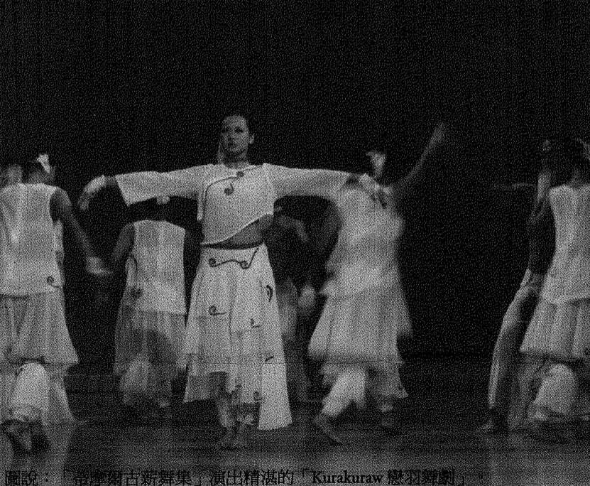
圖說：「蒂摩爾古薪舞集」演出精湛的「Kurukuraw 戀羽舞劇」。

體力行來體現台灣電影藝術之美,增進對台灣傳統藝術與文化的認識。舞蹈表演則安排了「蒂摩爾古薪舞集」~Kurukuraw 戀羽舞劇,帶來融合傳統部落與現代舞蹈的新原住民美學舞蹈,此舞蹈是排灣族三寶之一的琉璃珠-孔雀之珠(Za-aw)的故事,讓學生透過舞蹈了解原住民文化,增進對多元文化的理解與尊重,萌生保存傳統文化的意識。