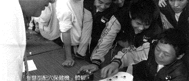
圖說：「智慧型配穴保健機」體驗。