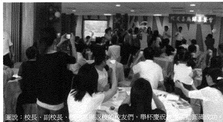
圖說：校長、副校長、校友與返校的校友們，舉杯慶祝，歡聚圓滿成功。