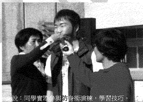
說：同學實際參與防身術演練，學習技巧。