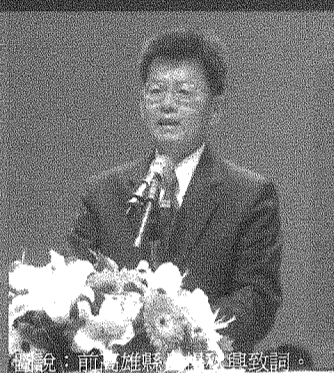
圖說：前高雄縣市長致詞。