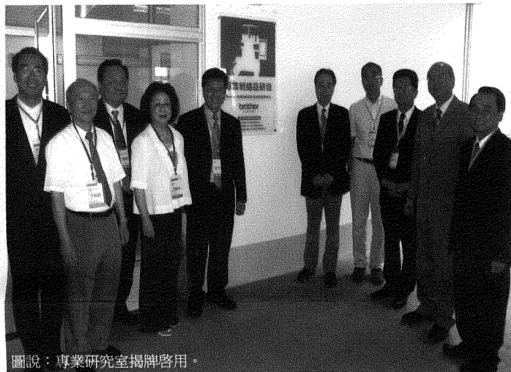
圖說：專業研究室揭牌啓用。