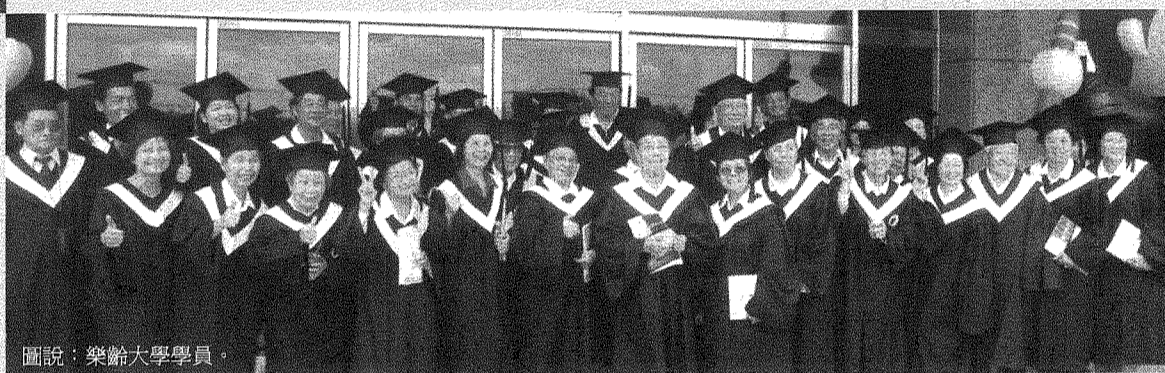
圖說：樂齡大學學員。

這一場百年畢業典禮的盛會，還好有老天爺的協助，有著風和日麗的天氣。最後在依依不捨的氣氛下，完成這場千人畢業盛會。