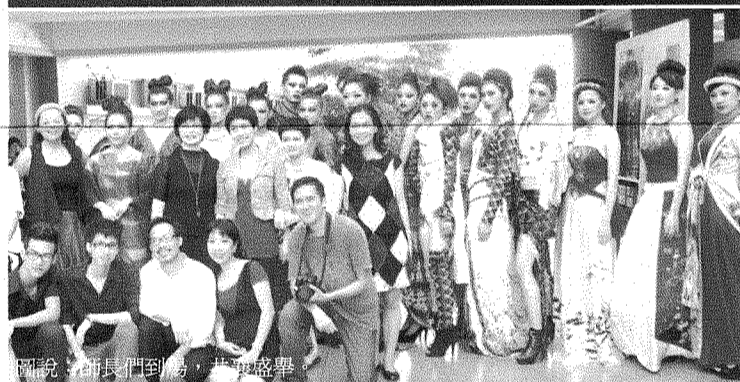
圖說：師長們到場，共襄盛舉。