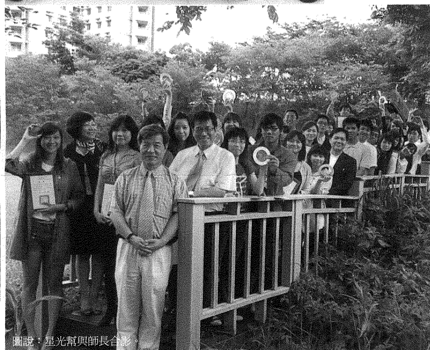
圖說：星光幫與師長合影。

【本校訊】為表揚本校於專業領域有傑出表現之優秀學生，學務處生活輔導組於6月1日舉辦100級畢業典禮系列活動「星光大道名人榜—優秀學生表揚典禮」，由朱元祥校長頒發象徵學校最高榮譽的「星光大道名人榜」獎項給64位特殊優異事蹟學生，其中流行設計系6組6人、生活產品設計系有4組7人、應用設計研究所1組2人、視覺傳達設計系3組15人、室內設計系1組2人、電腦與通訊系3組15人、資訊管理系1組5人、國際企業與貿易系1組9人，以及應用外語系、休閒事業管理系、資訊工程系等各系1組1人獲獎；獲獎人員的優異事蹟與星座琉璃將安裝在星光大道，以為師生典範。