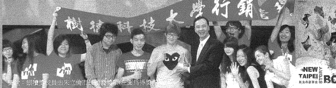
圖說：銀犢獎成員由朱立倫市長頒發獎項(左圖為得獎)。

本校創校雖僅14年，但在已辦理二十屆的金犢獎歷史中，曾兩次榮獲金犢獎，總規劃的視傳系主任楊裕隆、張建豐，以及行銷系陳美蓉等老師功不可沒。