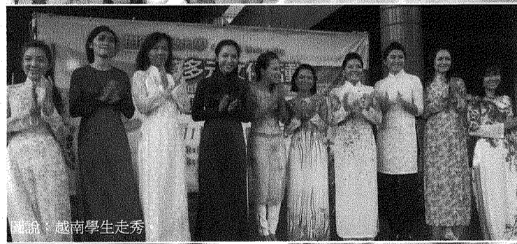
圖說：越南學生走秀