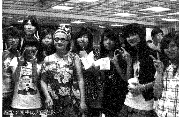
圖說：同學與大師合影。