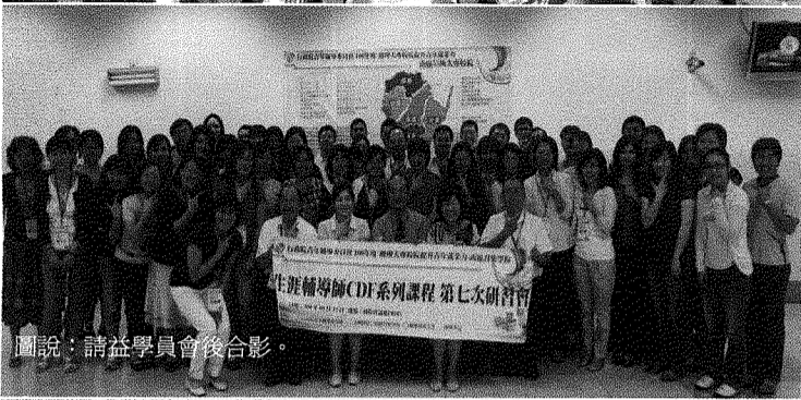
圖說：請益學員會後合影。

【本校訊】青輔會給了樹德科技大學國際同圓社一個服務大眾並融入動力的機會。我們知道一定要再給這兩所國小的小朋友一次冬令營的感動，在這個學期的服務，一直把夏令營這個活動當作是給小朋友願意參加活動為終極目標，也是讓志工夥伴和小朋友們能在夏令營時更加的付出。 在課後輔導的時間總是提醒小朋友們品德教育的重要性，其實夏令營就是這個學期對志工團以及小朋友的總驗收。經由夏令營夥伴們的付出，讓這次的活動更加的成功，也順利的培養和大寮國小與昭明國小的小朋友們相處的默契與模式。