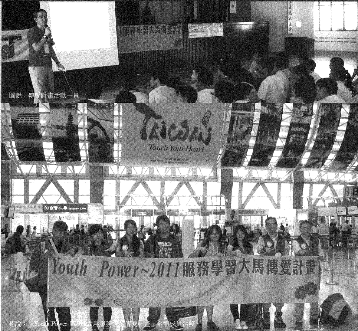
圖說：傳愛計畫活動一景。

本校" Youth Power服務學習大馬傳愛計畫"是由行政院青輔會部分補助，加上該校全力的支持並由志工們自費才能成行，但是大家都覺得這次的國際志工活動非常有意義，更學習到很多，對於志工們而言，是一場難得的學習之旅。