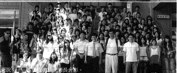
圖說：觀摩團、團輔團、師長合影。