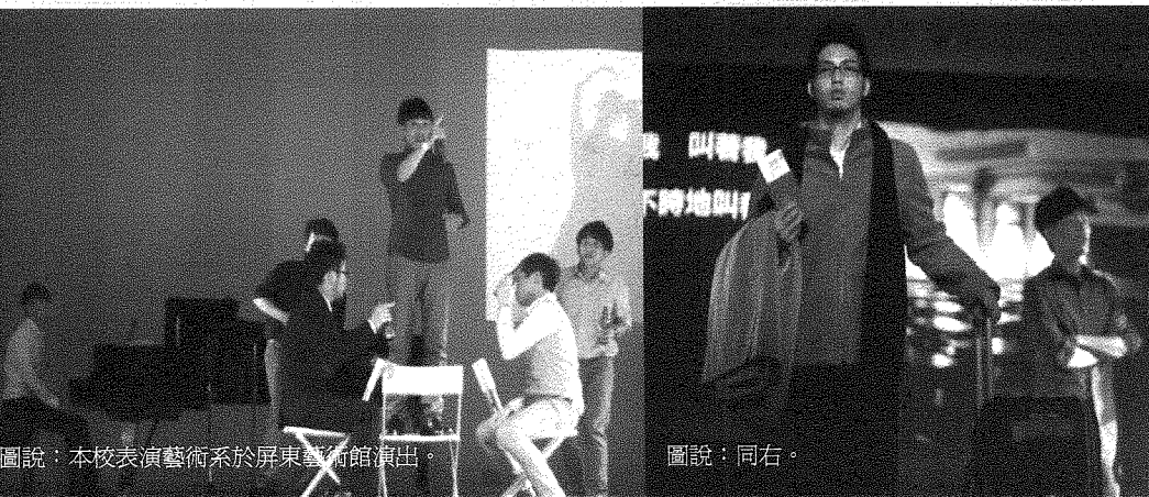
圖說：本校表演藝術系於屏東藝術館演出。