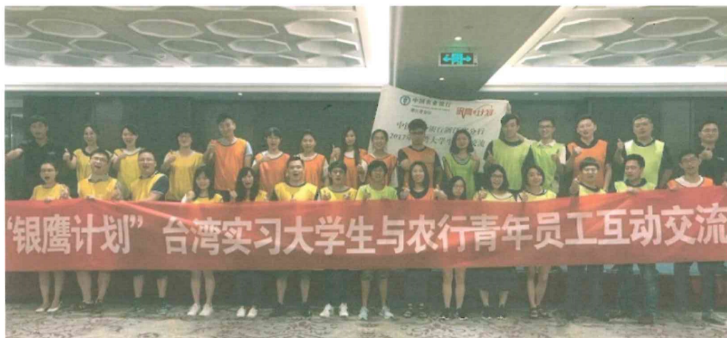
圖說：各銀行實習生之一