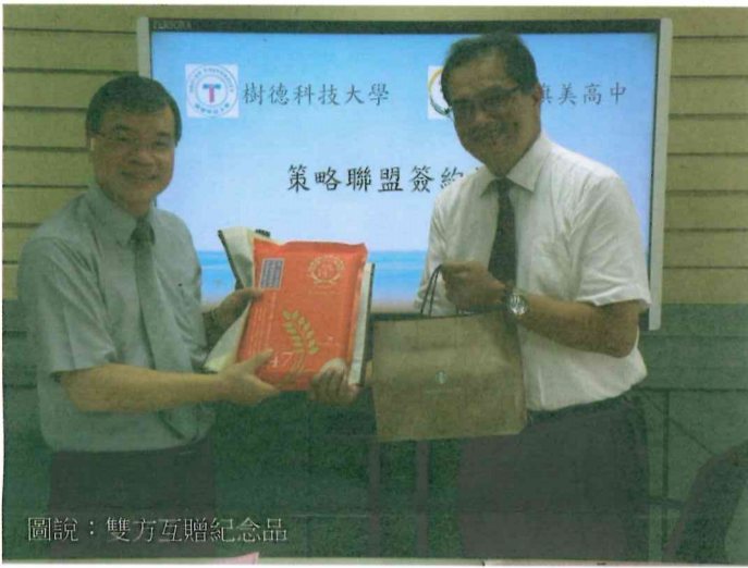
圖說：雙方互贈紀念品