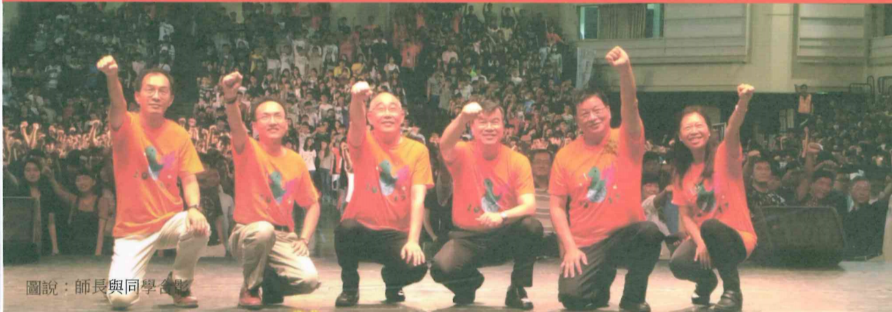
圖說：師長與同學合影

詳情請查： http://reg.aca.stu.edu.tw/category/master_audition