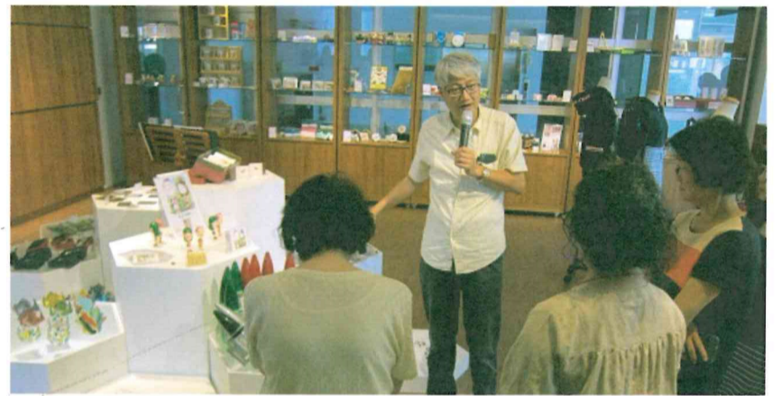
圖說：59號咖啡文創館參觀

參加人員對於本校師生研發的文創商品琳琅滿目，多達 610 種品項，個個耳目一新；而國際精品蠶絲皮包詩威博登與葫蘆工坊也加入展售，更是讓學員驚訝連連；下半場主辦單位安排參訪管理學院國際企業與貿易系、企業管理系、行銷管理系等，皆由系主任與專任教師導覽解說。