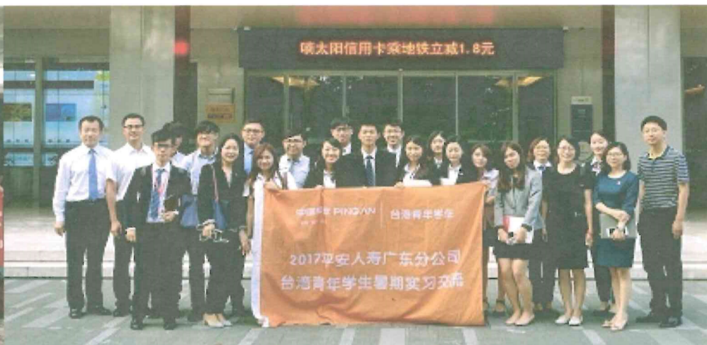
圖說：各銀行實習生之二