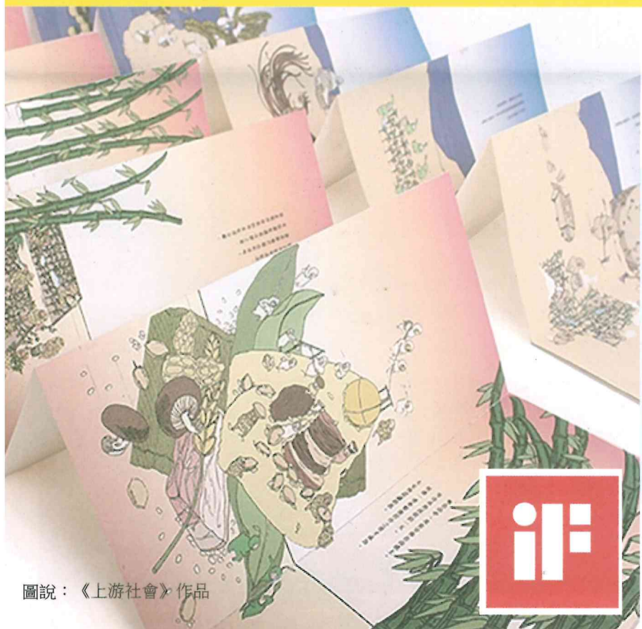
圖說：《上游社會》作品

【本校訊】本校視覺傳達設計系的《上游社會》與《蕨對值》二件作品獲2017紅點最佳獎（Best of the Best），另有8件作品獲紅點設計獎（RedDot Design Award），總計10件作品拿下12個紅點獎、2個最佳獎，不僅是全臺灣第一，更是全球之冠，師生在校長陳清耀全力支持下，於10月25日啟程前往德國領獎。另外8件紅點獎作品出版類有《台灣庶人》、《生態郵繫》、《俗畫說》、《袋原者》、《被殺的海》；品牌類有《結果》、包裝類為《金狀元》，以及三件插畫類《共冥》，其中已獲出版類紅點獎的《生態郵繫》與《俗畫說》也同獲插畫類紅點獎。