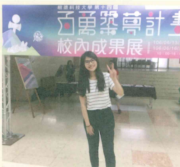
圖說：獲選第十四屆百萬築夢競賽