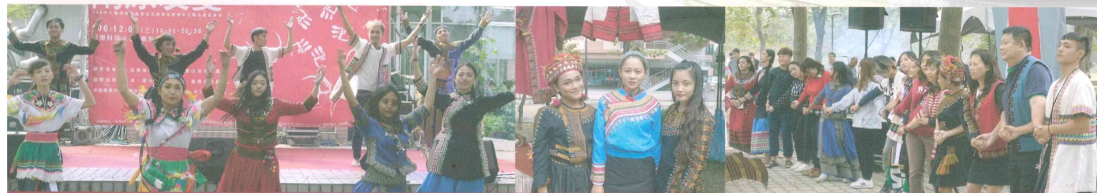
圖說：原勢力社演出