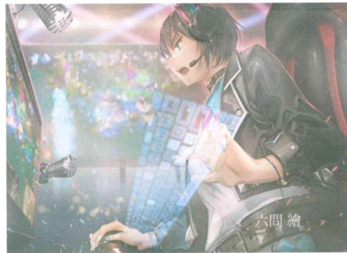
圖說：電競好手虛擬偶像「STU Girls」