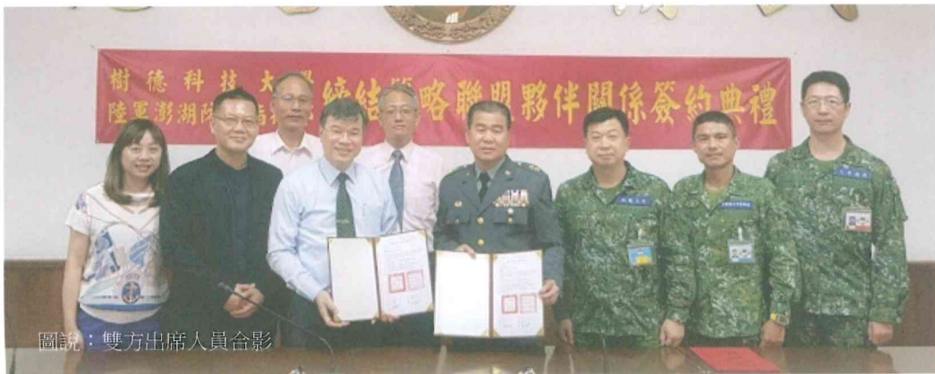
圖說：雙方出席人員合影