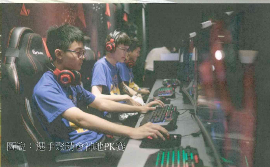
圖說：選手聚精會神地PK賽