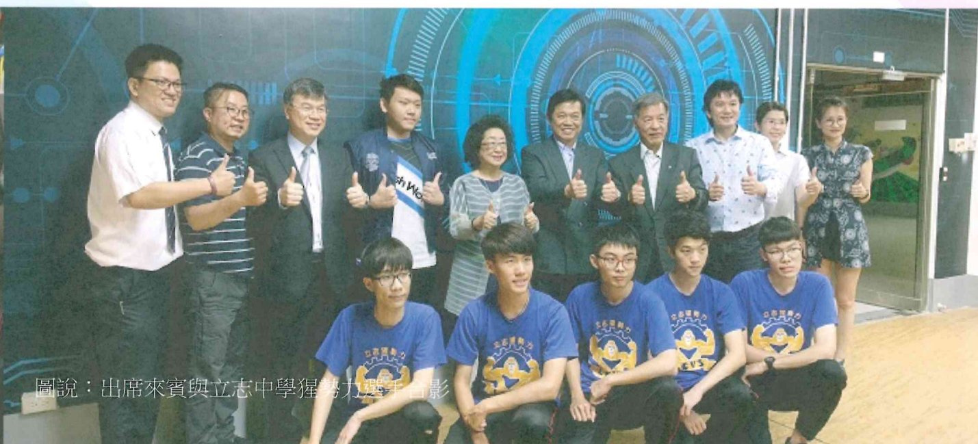
圖說：出席來賓與立志中學猩勢力選手合影