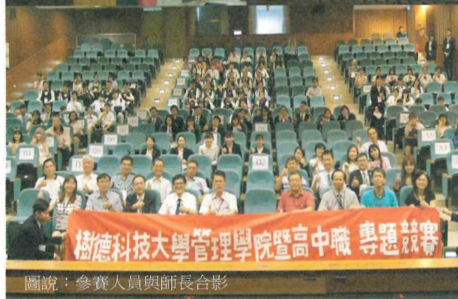
圖說：參賽人員與師長合影

今年主題《Together / 一起》，象徵兩校 15 年東西文化交流的融合，未來在台美文化皆占有一席之地。劉天民教授並以 15 年前首次與樹德科大交流的陳年照片做成簡報，年輕稚氣的臉龐、歲月的痕跡，引起師生哄堂大笑，但其實每個人的心裡是有著更多的回憶與崇拜。