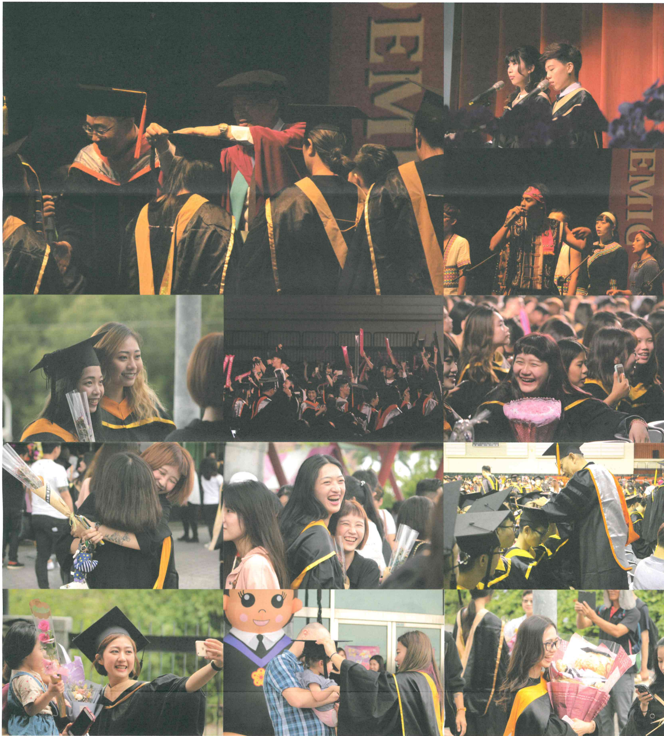
圖說：畢業典禮花絮