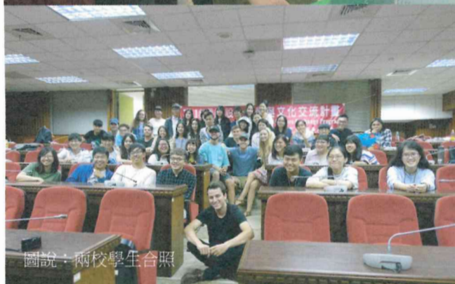
圖說：兩校學生合照

【本校訊】資訊學院攜手高中職校舉行「2018 年資訊學院專題成果展覽專題競賽」，及「106 學年度資訊學院優秀畢業生表揚大會」，開幕暨頒獎典禮皆由嚴大國副校長主持，其以「華山論劍，知己知彼，互相觀摩交流，開拓視野」勉勵參與者體會別人想法，學無止境，幫助自己成長創作，做為目標前進。參賽項目分為大學組的資訊創用組 30 組、及高中職組資訊新苗組 25 組，比賽總獎金高達 179,000 元。前三名獎金分別是 1 萬元、7 千元、5 千元不等，優勝 2 千元、佳作 1 千元。優秀學生表揚獎項包括應屆畢業生錄取研究所 44 人次、參與校外競賽得獎者 216 人次、特殊表現者有 23 位。