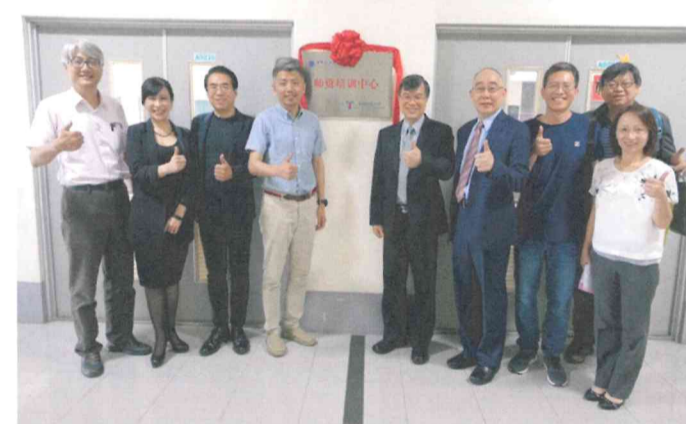
圖說：揭牌後出席人員合影

主辦的樹德科大國際及兩岸事務處再三說明，將朝專班方向努力，讓交流學生對台灣的課程有感，同時在下學年度也會快速擴充完成「日照職業技術學院師資培訓中心」的各項設備。