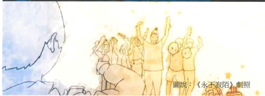
圖說：《永不寂陌》劇照