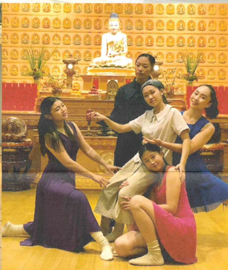
圖說：學生韓國風舞蹈演出