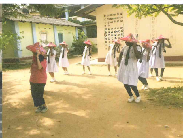
圖說：一起跳客家傳舞