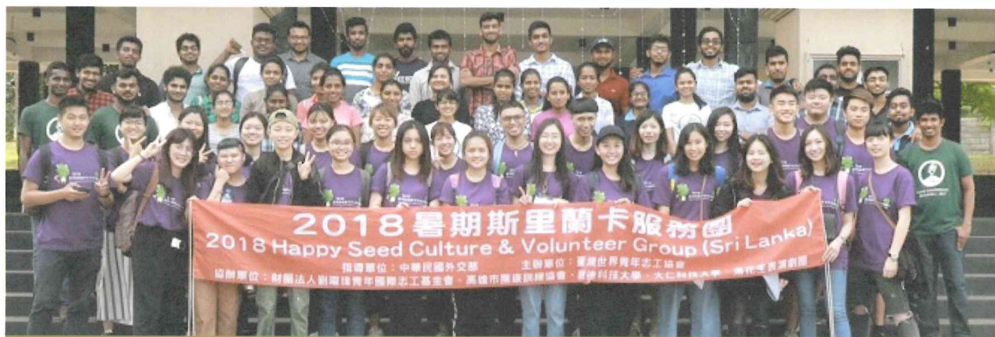
圖說：斯里蘭卡國際志工服務隊與當地大學生合影