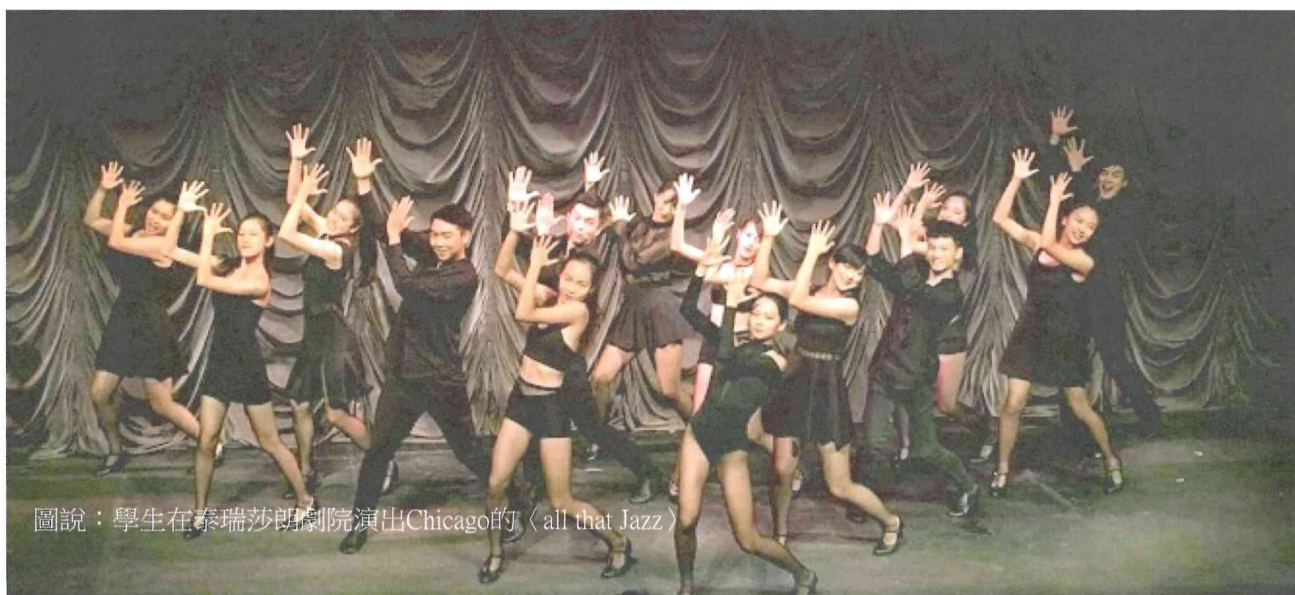
圖說：學生在泰瑞莎劇院演出Chicago的〈all that Jazz〉