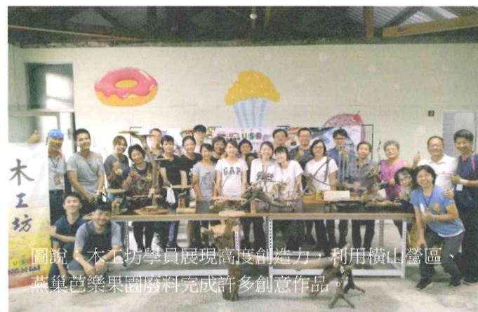
圖說：木工坊學員展現高度創造力，利用橫山營區、燕巢芭樂果園廢料完成許多創意作品。

」空間活化改造、「橫山小學堂」的橫山營區司令台空間創意改造、「橫山USR 外推中山高仁德服務區」閒置空間活化再利用、「高雄蓮潭會館會議中心大廳」會展場域提案、「橫山168 大學旅宿」空間專業實踐學習；籌備中的「橫山工藝微聚落」五大工坊分別為木工坊、彩裝工坊、染織工坊、綠工坊、金工坊，延伸成主題工作坊之教學、研習、體驗與創業課程等行動方案，讓跨縣市或是在地社區民眾可實質參與，從寓教於樂中發掘具有設計潛力與未來願意投入在橫山營區工藝（微）聚落駐點的人才，乃至於將設計文化媒體技術應用擴大到生產、製造、行銷的「三環區」，對於USR 具體實踐行動，將能創發出更多成功模式。