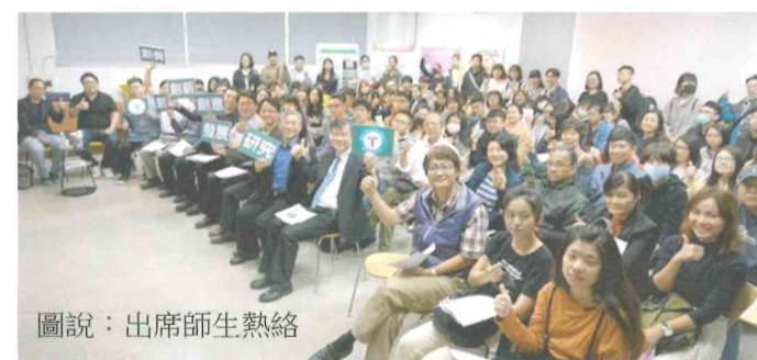
圖說：出席師生熱絡

與會人員對「研發成果聯合展示發表會」讚許有加，計畫類別或作品包含 4 項研發、12 組師生研發團隊成品、3 項產品化作品、大學社會責任師生研發團隊 13 組作品、政府產學先期計畫 3 組。無論是實體作品、或是設計等皆讓參觀者驚喜連連。