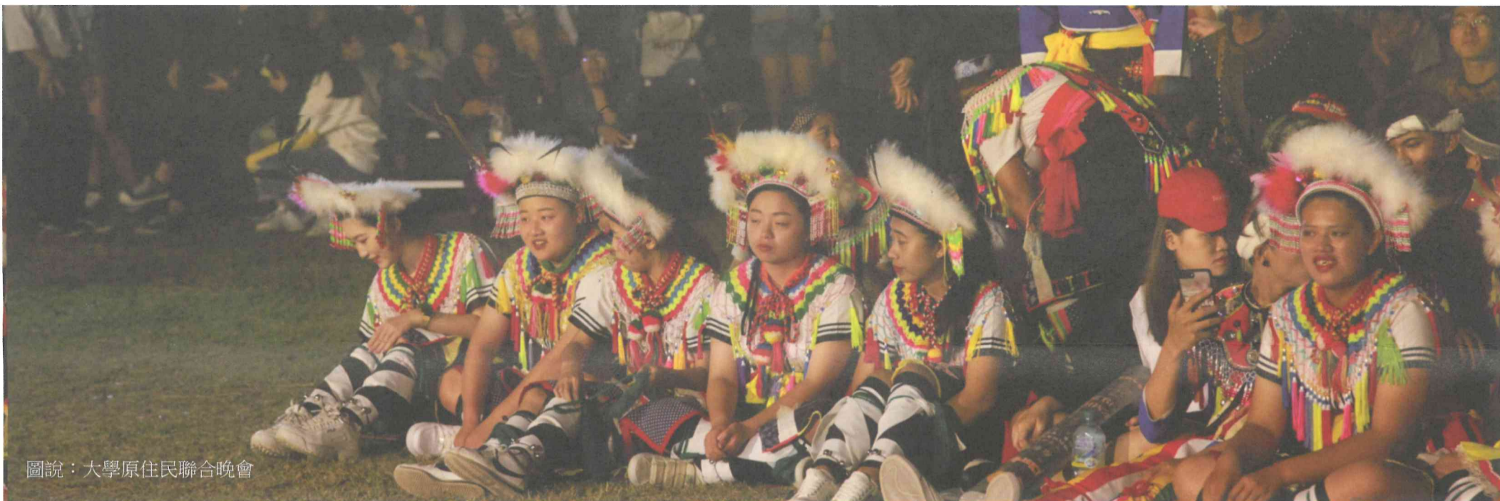
圖說：大學原住民聯合晚會