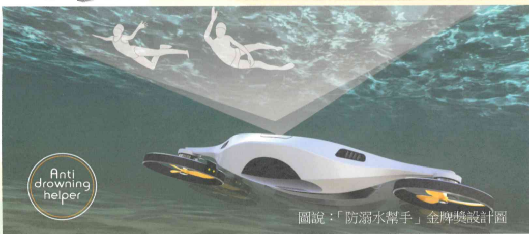
圖說：「防溺水幫手」金牌獎設計圖

金牌獎作品有「防溺水幫手 / Anti-drowning helper」與「節能綠美化植栽遮陽裝置 / PLANTING SHADING DEVICE」；銀牌獎作品有「交通無人機 / Traffic drone」、「將芯筆芯一醫療輔具 / MEDICAL ASSISTIVE DEVICE」。