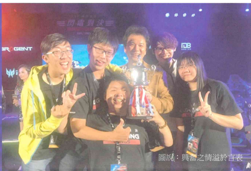
圖說：興奮之情溢於言表