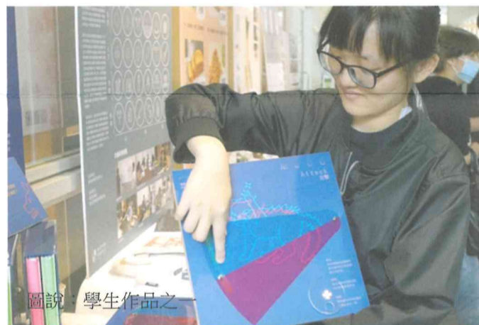
圖說：學生作品之一

片。《只有大海知道》耗時六年完成，取材真實事件，敘述蘭嶼椰油國小師生故事，以男孩成長故事引出離島謀生不易的達悟族人的心聲。畢業於椰油國小的女同學說，看完影片好像回到家鄉；來自台東市閩南生，因為路途遙遠許久未返鄉，一邊看著電影潸然淚下；其他不同部落的原民生，或許自身家庭故事情節不同，但好山好水卻無法創造財源，是另一種內心的矛盾與煎熬，對部落去留都有一種期待與落寞之情。