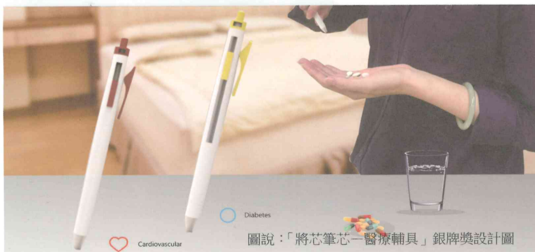
圖說：「將芯筆芯一醫療輔具」銀牌獎設計圖

溺水只在瞬間又無情，游泳員也無法預知溺水的徵兆；而救援設備或人員，又往往距離遇難者太遙遠、或無人注意到溺水者，因而錯過黃金救援時期。「防溺水幫手」構想是一台可攜式水中救援無人機，裝載可充氣的氣囊及體感偵測裝置，當偵測人在水中有異常動作時，立即游向溺水者，氣囊自動充氣，提供溺水者浮力救援，並輔助溺水者往岸邊移動；戲水活動結束後，「防溺水幫手」偵測水中無人時，會自動回到岸上，或由使用者透過手機操縱，將「防溺水幫手」歸位。