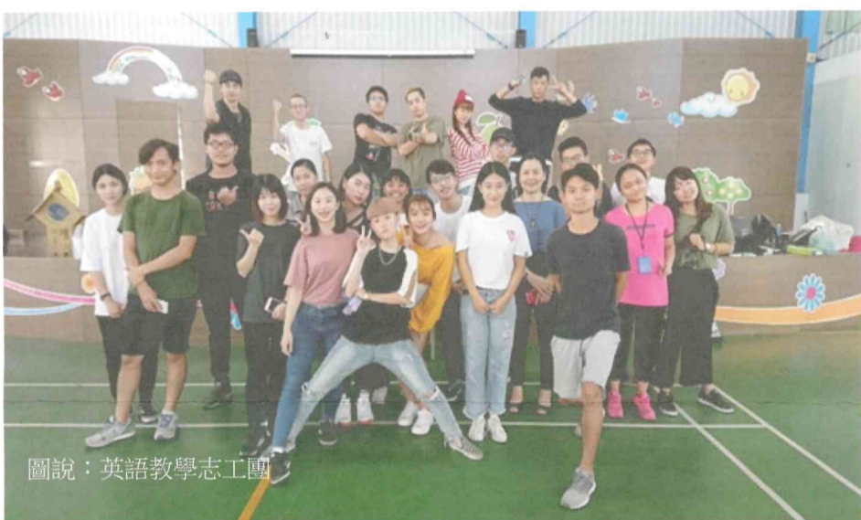
圖說：英語教學志工團