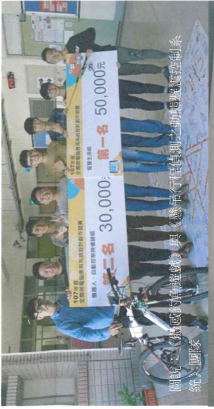
圖說：《體感釣魚遊戲》與《懸吊行程偵測之動態避震控制系統》團隊

創新技術實證 MBA 組得獎者有金獎—台灣大學、銀獎—樹德科大、銅獎—中山大學，以及佳作獎包括台灣大學、台灣科大、政治大學、成功大學，樹德科大能在多所尖大學的碩博士生隊伍中脫穎而出，實在是相當優異。