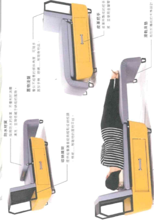
圖說：「多功能看護躺椅裝置」作品海報

「多功能看護躺椅裝置」考量看護者 24 小時在狹窄病房照料患者，身心承受極大壓力，卻只有簡陋看護床勉強棲身，導致身心無法充分休息。因此發想設計出提供看護者完善與舒適的多功能看護躺椅。作品整體造型融入臘腸狗意象，隱喻看護者用心照顧病患，為作品內涵加值。該躺椅可乘坐及休憩睡覺時伸縮疊放；滑軌式設計，操作便捷；可調式設計，滿足不同長度需求；伸縮推疊設計，節省空間；置物設計，便於放置物品；皮革與軟墊設計，坐躺臥皆舒適，符合人體工學。