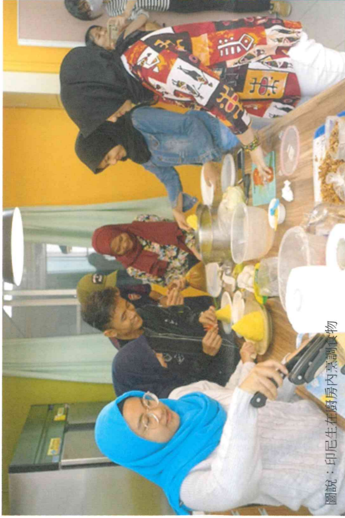
圖說：印尼生在廚房內烹調食物