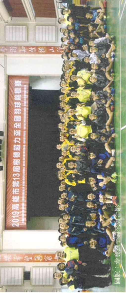
圖說：參賽選手與來賓合影

本系體育志工在寒假前二個月，即規劃籃球、體適能、探索教育、舞蹈律動、民俗體育、水域安全等活動課程，在群山環繞部落散理，每天的歡笑聲響徹山林的每一個角落，大小孩的互動與對體育課程的喜愛，一一寫在臉頰上。