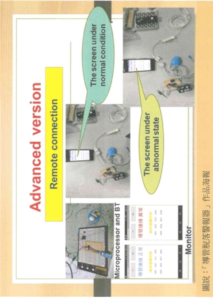
圖說：「導管脫落警報器」作品海報

「多功能看護躺椅裝置」考量看護者 24 小時在狹窄病房照料患者，身心承受極大壓力，卻只有簡陋看護床勉強棲身，導致身心無法充分休息。因此發想設計出提供看護者完善與舒適的多功能看護躺椅。作品整體造型融入臘腸狗意象，隱喻看護者用心照顧病患，為作品內涵加值。該躺椅可乘坐及休憩睡覺時伸縮疊放；滑軌式設計，操作便捷；可調式設計，滿足不同長度需求；伸縮推疊設計，節省空間；置物設計，便於放置物品；皮革與軟墊設計，坐躺臥皆舒適，符合人體工學。