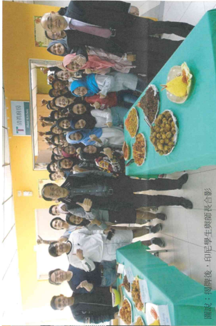
圖說：揭牌後，印尼學生與師長合影