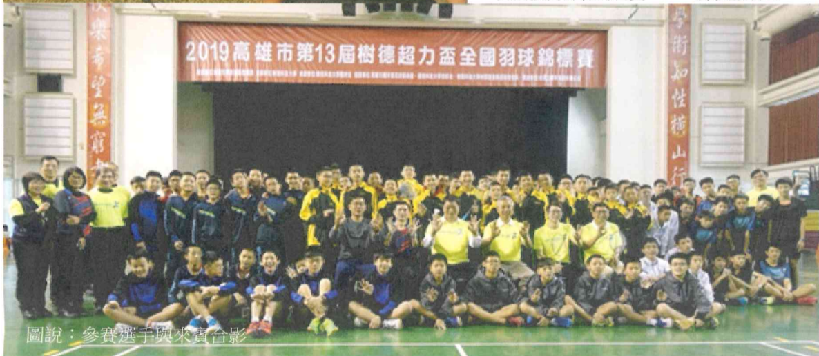
圖說：參賽選手與來賓合影

本次參加營隊的小朋友，體育署也贈送每人一組扯鈴，希望扯鈴運動融入生活中，讓自己學習專注，永遠保有正向熱情的心，翻轉自己也翻轉自己的故鄉。