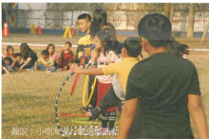
圖說：小朋友進行體適能活動