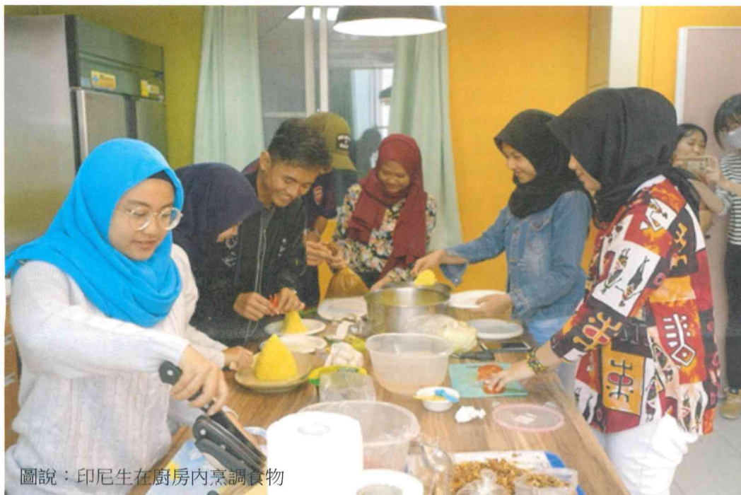
圖說：印尼生在廚房內烹調食物