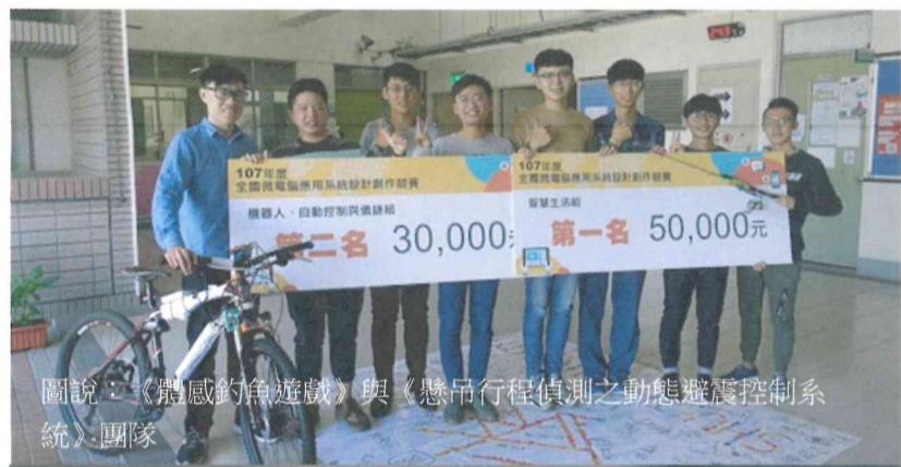
圖說：《體感釣魚遊戲》與《懸吊行程偵測之動態避震控制系統》團隊