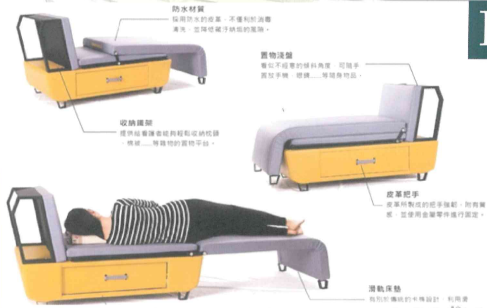
圖說：「多功能看護躺椅裝置」作品海報

「箱網養殖監測器」係針對近海之箱網養殖區域、或人工養殖魚池等環境，應用人工智慧 (AI) 來協助漁民進行箱網養殖，作品特色具有太陽能儲能、水質感測、攝影監視、緊急藥品收納、超音波驅鳥、App 介面操控等功能，並結合物聯網與人工智慧技術，能有效監測魚群，大大增進箱網養殖魚群之監測管理效率，且降低漁民的出海次數，未來商品化後能大量生產，極具市場未來性。