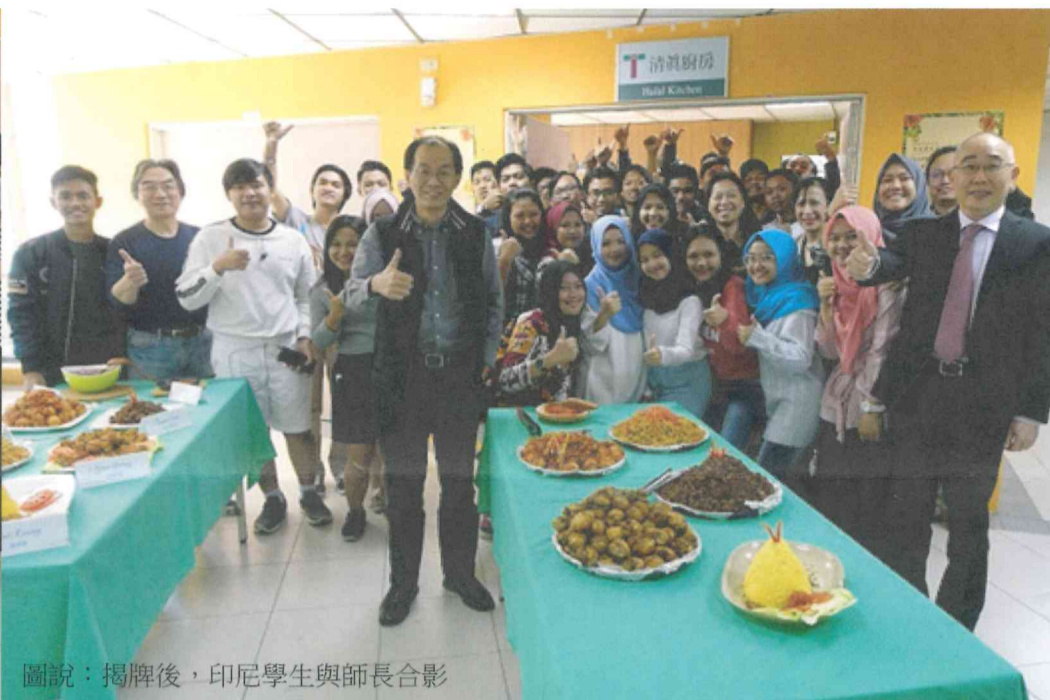
圖說：揭牌後，印尼學生與師長合影