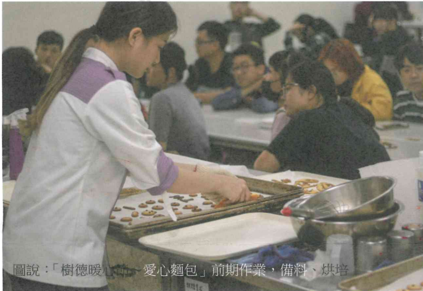
圖說：「樹德暖心節」愛心麵包「前期作業，備料、烘培