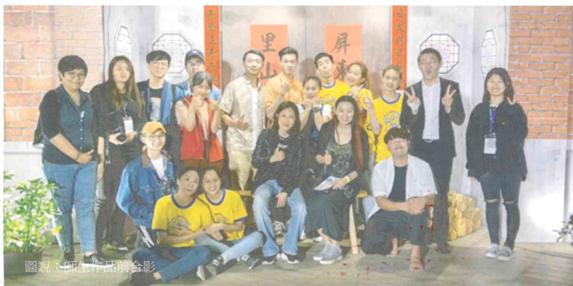
圖說：師生作品前合影