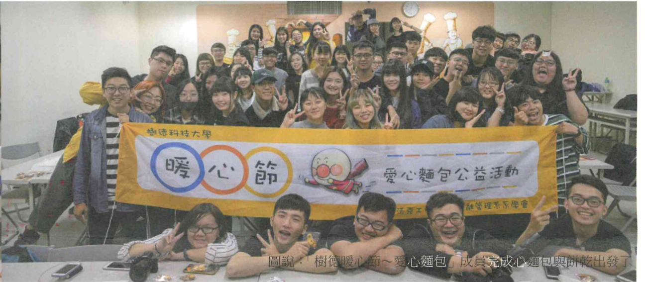
圖說：樹德暖心節~愛心麵包「成員完成心麵包與餅乾出發了