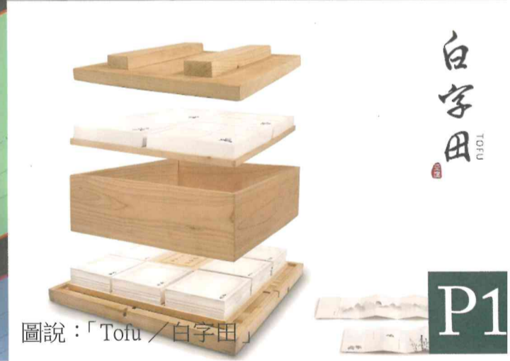
圖說：「Tofu / 白字田」