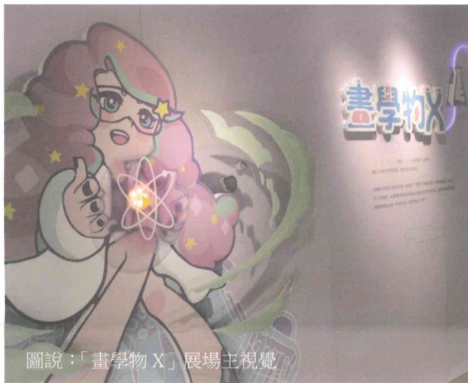
圖說：「畫學物X」展場主視覺